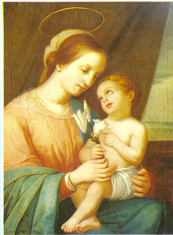
Pittura bl-isem 'Madonna del Giglio' attribwita lil Francesco Vaccaro u li tinsab fil-Mużew Ċiviku ta' Caltagirone ġewwa Sqallija.

Jidher li l-pittura tal-Madonna tal-Ġilju kienet ferm għal qalb il-familja Vaccaro. Fl-1951, wieħed mill-werrieta tal-familja Vaccaro għadda 'l fuq minn mitt kwadru u mitejn u tletin disinn iehor li saru mill-antenati tiegħu lill-Mużew ta' Caltagirone. Bħala kundizzjoni huwa ried li l-kwadru ' Madonna del giglio '