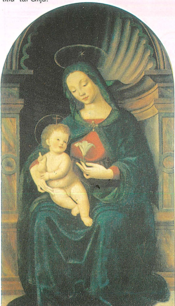
Il-kwadru devot tal-Madonna tal-Ġilju ġewwa Firenze.

Id-devozzjoni lejn il-Madonna ġewwa l-Italja hi mferrxa sew u madwar il-pajjiż kollu nsibu l-Madonna meqjuma taht diversi titli. Huma diversi l-ibliet Taljani u postijiet importanti iddedikati lill-Madonna. Fost dawn insibu l-famuż Duomo ġewwa Firenze, ddedikat lil Santa Maria del Fiore. Importanti wkoll hija r-rabta ta' Firenze mal-ward u saħansitra anke l-arma tal-lokal tirrapreżenta l-ġilju. Mhix haġa kbira għalhekk li fl-istess post insibu devozzjoni antika lejn il-Madonna taht it-titlu 'tal-Ġilju.'