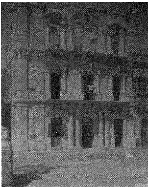
Ritratt storiku tal-faċċata tal-każin f'fazi avvanzata ta' bini.