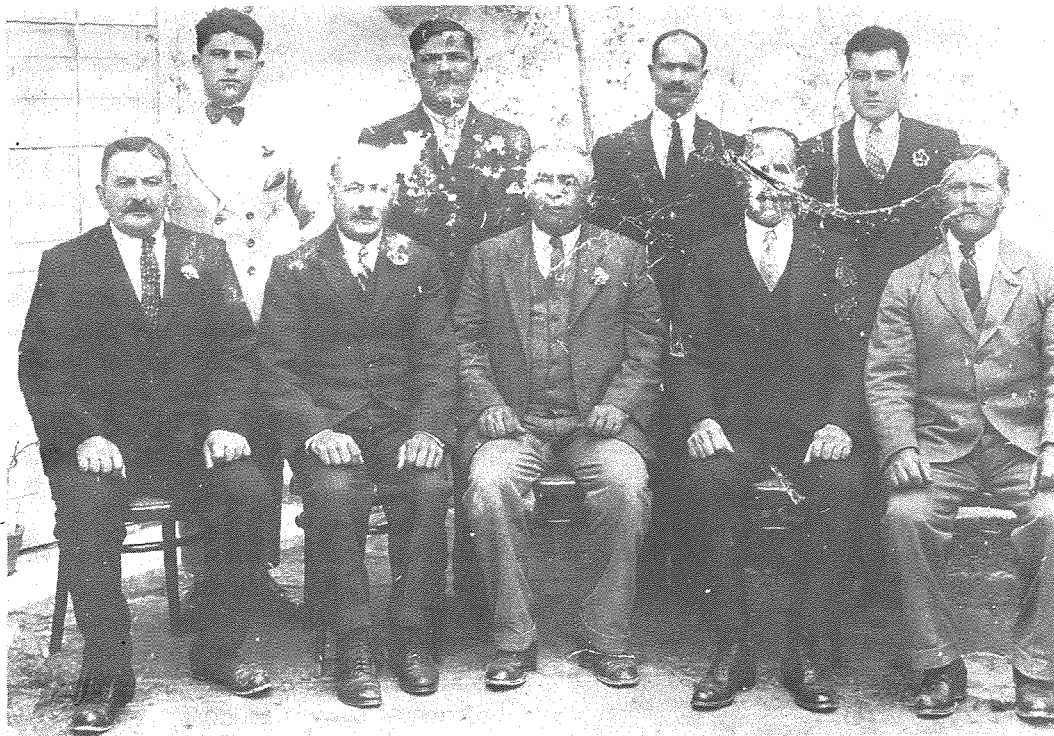
Ritratt ta' kumitat ta' l-ewwel snin tas-soċjetà. Fosthom hemm uħud li wara okkupaw il-kariga ta' President tas-Soċjetà.