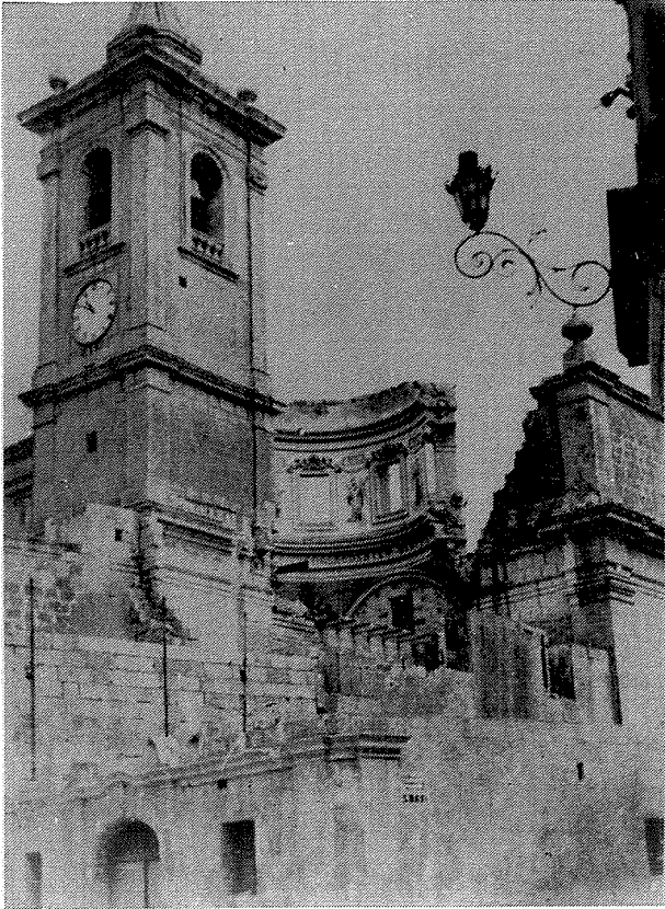
Jidhru l-Fdalijiet tal-Koppla wara l-attakk tad-9 ta' April 1942

L-anzjani tar-raġal tagħna wkoll ifakkruna fil-ħsara li ġarrbet l-istatwa tal-Madonna tal-Ġilju fl-istess attakk. Huma jsostnu li minkejja li l-istatwa ntradmet kompletament, mirakolożament ma sofrietx ħsarat kbar. Li hu żgur hu li tkissret ras is-serp u l-istess ġara lis-serp ta' taħt il-Kunċizzjoni fiz-zuntier tal-knisja. Dawn id-dettalji ma nsibuhomx imniżżlin fl-arkivji tagħna, iżda żgur li ma nistgħux inwarrbuhom.