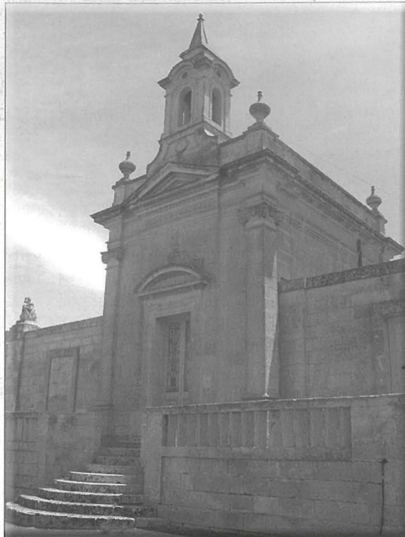
Il-kappella taċ-ċimiterju ddedikata lil Ġesù Nazzarenu.

Il-miġja tal-fidi f'Ġesù Kristu ġabet maghha sens ġdid lejn it-tama tal-bniedem f'hajja ahjar u isbah wara li tintemm dik ta' fuq din l-art. Il-katakombi estensivi li nbnew f'Malta huma xhieda ta' kemm il-Maltin kienu jghożżu lill-mejtin taghhom, waqt li hallew il-maktur tal-fidi jixxottalhom id-dmugh tal-firda. Ir-rahall ċkejken tal-Imqabba wkoll ghandu patrimonju mill-aqwa tat-tradizzjoni funerarija ta' pajjiżna. Biżżejjed insemmu l-oqbra Puniċi 'Tal-Gherien' u 'Ta'