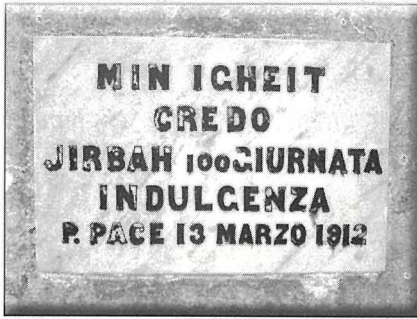
L-irhama li tixhed l-ghoti tal-indulgenza mal-faċċata tan-Nazzarenu, miktuba b'Malti tal-epoka.

Nazzarenu; impenn li beda b'ticrità t'ghanqbuta u ntemm b'tingiza ta' palma.