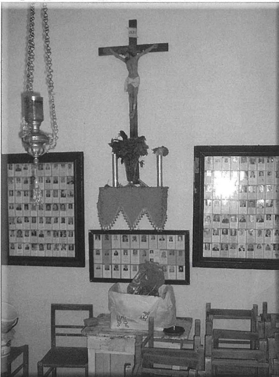
Il-kurcifiss li tahtu kien jitpoġġa l-mejjet fit-tebut qabel ma ssir id-difna. Illum fil-kamra tal-kurcifiss jitwahhlu s-santi tal-mejtin biex it-tifikira taghhom ma tintemmx.

Fil-kappella tan-Nazzarenu ghadna nistghu naraw diversi oġġetti sagri li ilhom maghna ghexieren ta' sni. Nibdew l-ewwel bl-istatwa ta' Ġesù Nazzarenu li tinsab fuq l-artal. Ġesù jidher liebes libsa hamra wara li kien ghadu kemm gie fflagellat mal-kolonna tas-swat. F'rasu tinsab mghaddsa l-kuruna tax-xewk waqt li jdejh huma marbutin b'habel dehbieni. Il-pavaljun tad-damask li jintrama' fil-festi fuq l-artal ewlieni tal-kappella, sar b'weghda mill-Imqabbija Margerità Sciberras.