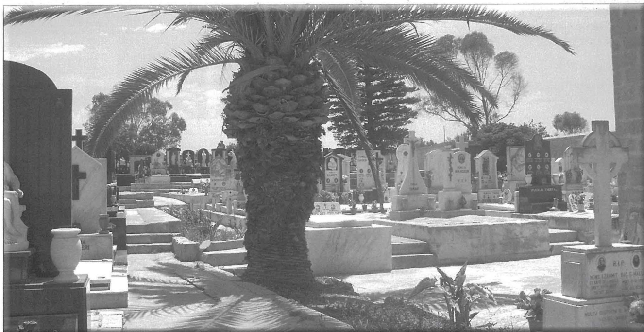
Parti mill-oqbra li nsibu ġewwa ċ-ċimiterju.