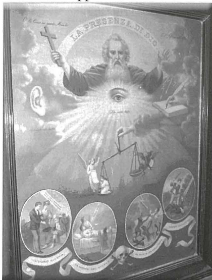
Santa antika, maghrufa bhala tal-Buona Morte, li tinsab fis-sagristerja.