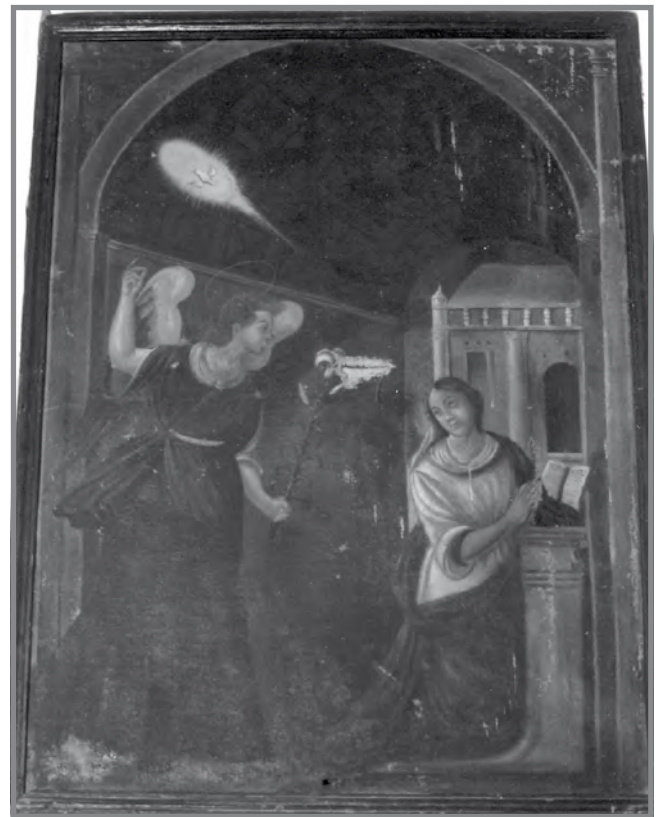
Il-pittura tal-Lunzjata li llum tinsab fis-sagristerija l-qadima u li fl-1615 kienet fuq l-artal li wara sar tal-Agunija.

Il-preżenza ta' dawn iż-żewġ artali fl-Imqabba, it-tnejn lejn l-Assunta, jikkonfermaw id-devozzjoni kbira li kien hemm lejn il-Madonna taħt dan it-titlu fi żmien tan-nofs. Din kienet influwenza qawwija Normanna. Għan-Normanni, l-Assunta kienet l-ikbar festa, tant li kienu ddedikaw lill-Kattidral tal-Imdina lilha. Fuq kollox, il-knisja li fi żmien tan-nofs kienet tagħmel magħha l-Imqabba, jiġifieri dik ta' Bir Miftuħ, kienet ukoll iddedikata lill-Assunta. Kienu biss bir-Riformi tal-Konċilju ta' Trentu li ma setax ikun aktar permess li jkun hemm artali ddedikati lejn l-istess titlu fl-istess knisja jew knejjes taħt l-istess titlu fl-istess parroċċa.