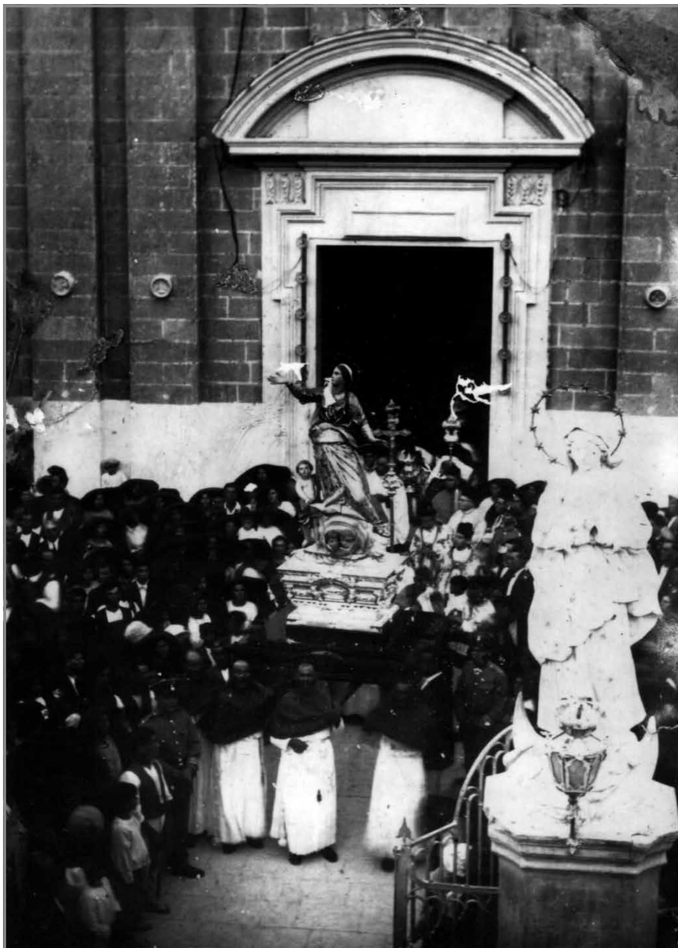
Il-hruġ tal-purċissjoni titolari fl-1928. Dan huwa l-egdem ritratt magħruf ta' purċissjoni bi statwa fl-Imqabba