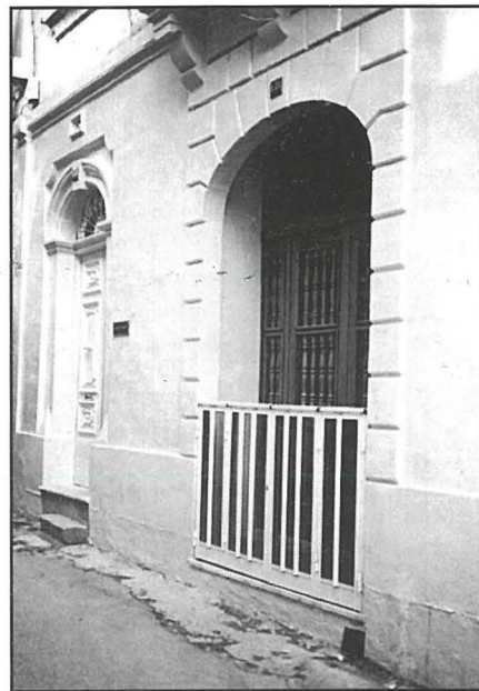
Dar Nemesja: fi Triq il-Parroċċa: li kienet f'idejn is-Sorijiet tal-Karità bejn l-1989 u l-1999.

It-tagħrif uffiċjali tal-Kongregazzjoni nnifisha ma tantx ivarja. Nistgħu niehdu tliet snin flimkien: bejn 1990 u 1992. Is-sorijiet kienu erbgha, u mbagħad ħamsa, imma ma damux ma niżlu għal tlieta. Kumment ta' l-1991 jagħti idea tal-qagħda tagħhom. Inkiteb: "Is-sorijiet ta' din id-dar mħumiex wisq, imma huma b'dispożizzjoni biex jintefgħu fuq servizz ċkejken fir-raħal. Waħda mis-sorijiet għandha kuntatt mat-