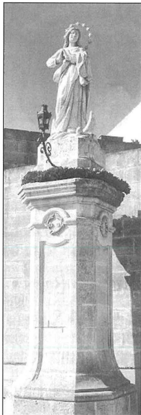
L-istatwa ta' l-Immakulata Kunċizzjoni li tinsab fuq il-Mentna ġewwa l-Imqabba.

Nixtieq nagħmel appell ċkejken lill-awtoritajiet fl-Imqabba, bhall-Kunsill Lokali, il-kappillan u l-kumitati ta' kull Soċjetà u Għaqda li teżisti halli jkomplu jiehdu hsieb dawn l-istatwi u niċeċ f'kulma jkun jehtieġilhom, inkluz harsien u kura mill-elementi, u xi drabi anke minn xi vandali.