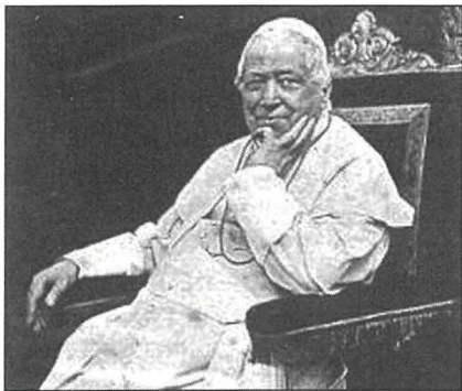
Papa Piju IX – il-Papa ta' l-Immakulata.

Għall-glorja tat-Trinità Mqaddsa l-Missier, l-Iben u l-Ispirtu s-Santu, bis-setgħa ta' Ġesù Kristu, ta' l-Appostli San Pietru u San Pawl, u tagħna – niddikjaraw, nordnaw u niddefenixxu bhala verità magħrufa li l-Verġni Mqaddsa Marija, bi privileġġ singolari u bil-grazzja ta' Alla, għall-merti ta' Ġesù Kristu, Feddej tal-bnedmin, sa mill-bidu tal-konċepiment tagħha għet imħarsa minn kull tebġha tad-dnub tan-nisel.