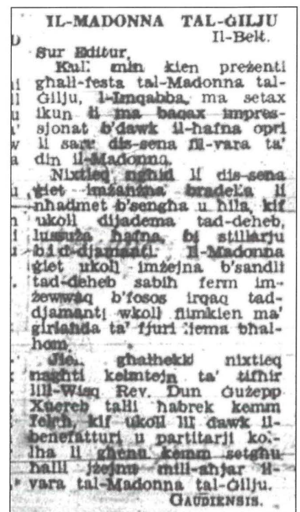
Il-Berqa – il-Gimgha 4 ta' Ġunju, 1954

Il-festa li saret impressjonat lil hafna nies tant li deħru diversi ittri f'ġurnali ta' dak iż-żmien. F'din is-sena kienu żżanznu diversi affarijiet fosthom il-bradella tal-Madonna tal-Gilju li kienet ffarrikt f'attakk mill-ghadu fuq il-knisja fid-9 ta' April 1942 kif ukoll is-sandli tad-deheb għall-