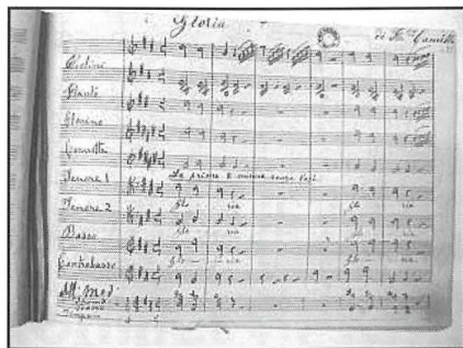
Riproduzzjoni ta' l-ewwel faċċata mill-partitura tal-'Gloria' u tal-'Kyrie'

kompożizzjonijiet li halla lil din is-socjetà nsibu l- Marcia Funebre La Morte di Cristo li kien ġie eżegwit waqt Akkademja li fakkret il-hamsin sena minn meta l-bomba Ġermaniża nifdet ir-Rotunda u ma splodietx. 29