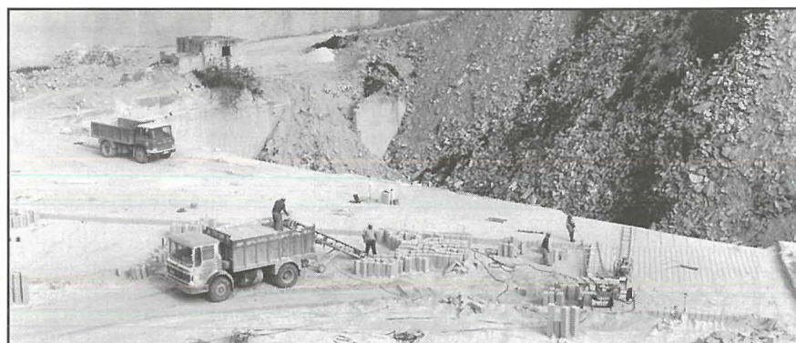
Xogħol ġewwa barriera fl-Imqabba llum.

Referenzi mehuda minn artiklu li deher fil-Lehen is-Sewwa tas-26 ta' Mejju, 1954. Grazzi wkoll lis-Sur Joseph Farrugia li tani kopja ta' dan l-artiklu u lis-Sur Charles Farrugia li pprova r-ritratti.