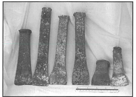
Spnajjar ta' diversi qisien.

Wara, l-blata tkun trid tinqata' minn taht. Il-ġenb il-mixxuf kienet jissejjah it-tavlatura . Fit-tavlatura kienu jagħmlu toqob li kienu jissejju kniener (wahda tisseejjah kenniera )