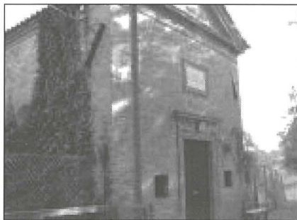
Il-kappella dedikata lill-Madonna tal-Ġilju fil-kontrada ta' San Silvestru fl-Italja.