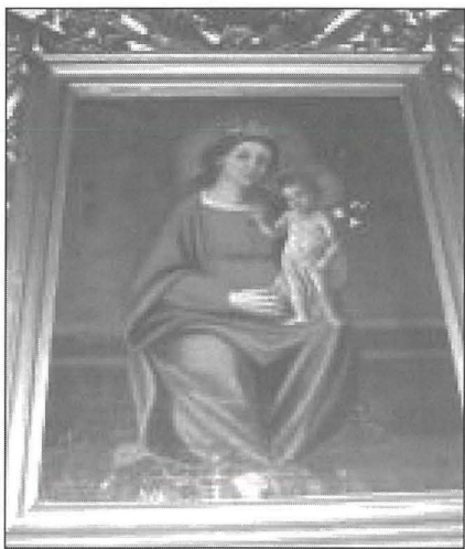
Pittura tal-Madonna tal-Ġilju meqjuma fil-konfini tal-parroċċa ta' San Silvestru fl-Italja.

Il-lokalità ta' San Silvestro tiffirma parti mill-Comune di Senigallia li jinsab fil-Provincja ta' Ancona ġewwa r-regjun ta' Marche.