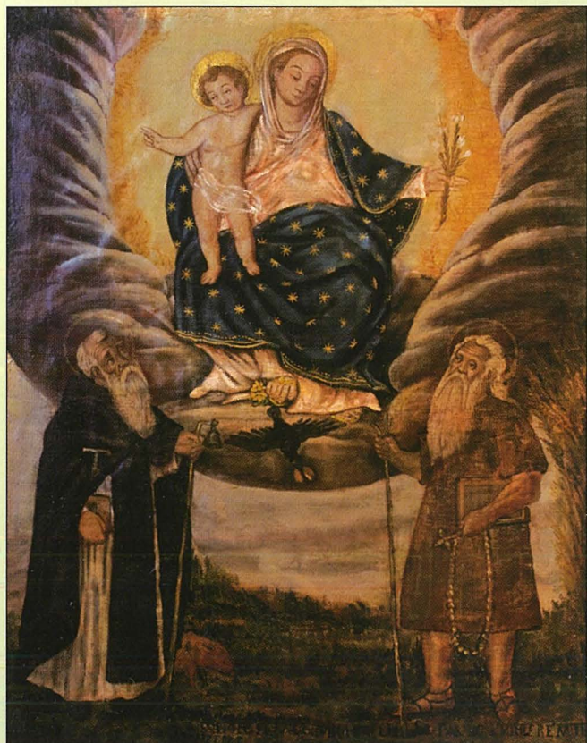
Pittura fil-Mużew tal-Kappuċċini fil-Furjana.

Il-pittura tirraffigura lill-Madonna bilqieghda bil-bambin Ġesu' fuqha u l-fjur tal-ġilju f'idejha. Fuq isfel tal-kwadru nsibu l-figuri ta' Sant' Anton Abbati u dik ta' San Pawl Eremita.