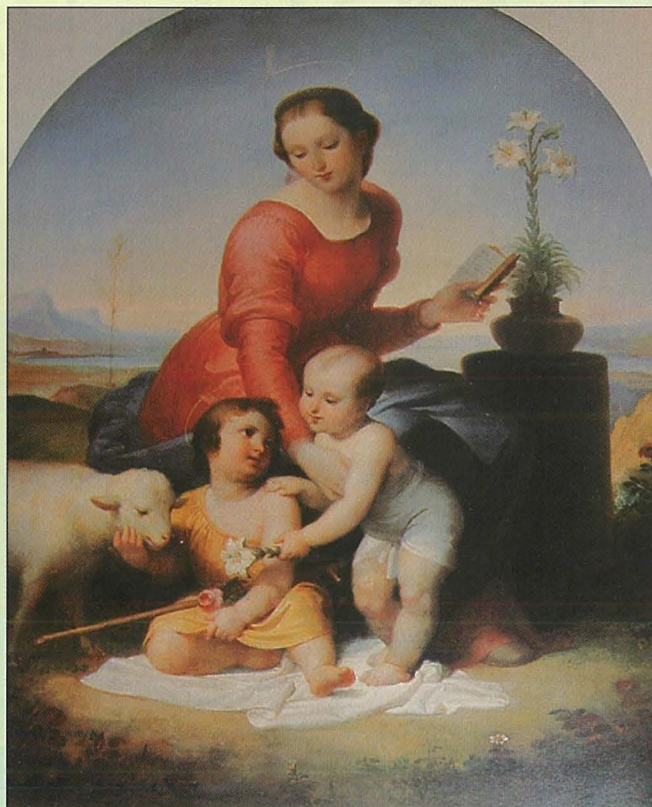
Il-Pittura Beata Vergine del Giglio miżmuma fil-Mużew Nazzjonali tal-Arti fil-Belt Valletta.