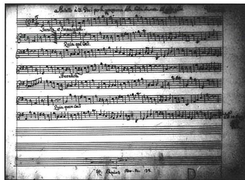
Partitura bl-isem tas-silta għall-purċissjoni tal-Madonna tal-Ġilju fl-14 ta' Mejju 1763 bil-kunjom Vella mniżżel

- Noel D'Anastas, 'L-attività mużikali fil-parroċċa Marjana tal-Imqabba', f'Charles J. Farrugia, Sicut Lilium: devozzjoni u ritwal tul is-sekli , Malta 2012, p. 510.