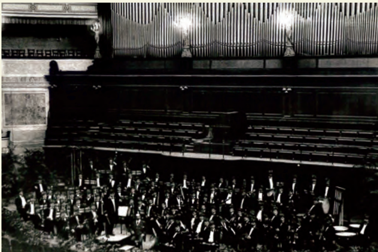
Il-Banda La Valette f'Ruma