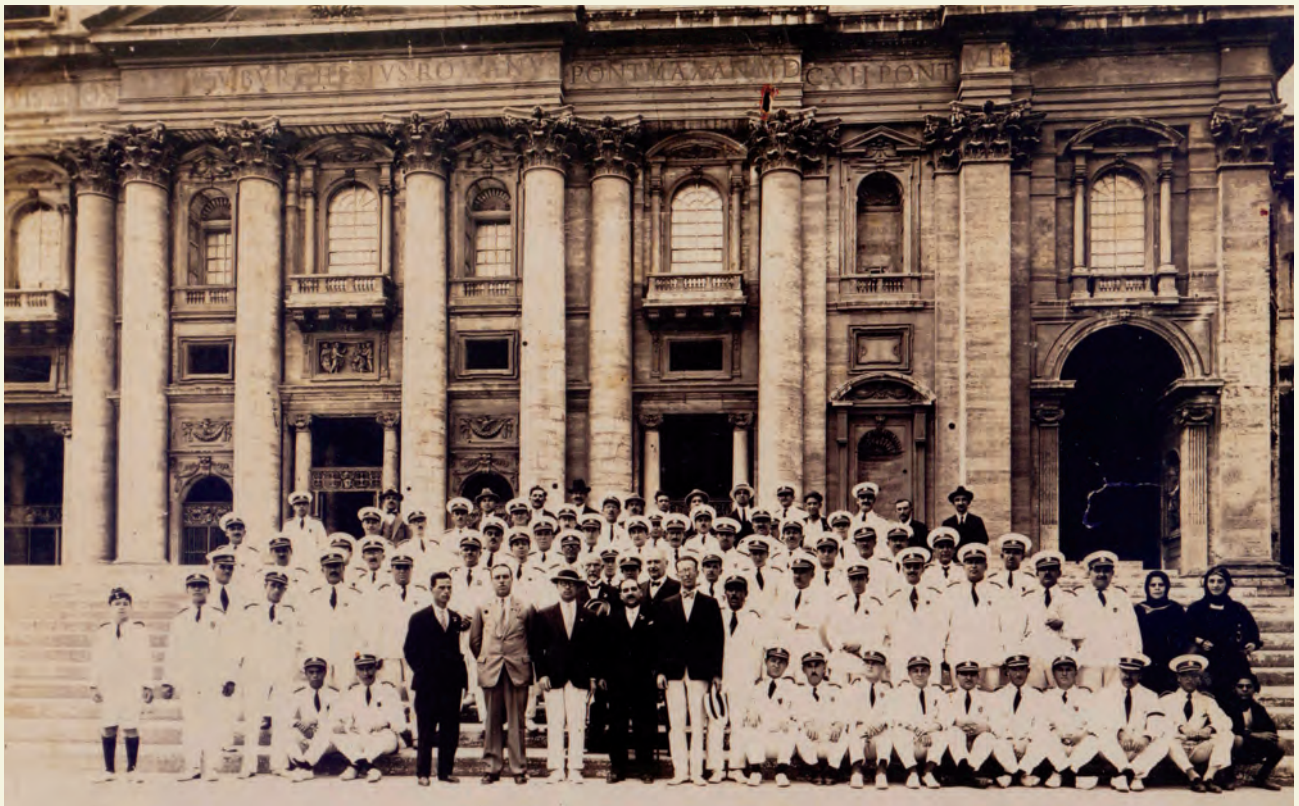
Il-bandisti tal-Banda La Valette quddiem il-Bażilika ta' San Pietru fil-Vatikan

Din l-intervista dehret fil-fuljett "La Valette - Socjeta' Filarmonika Nazzjonali Ottubru 1997 - No. 17" p. 11.