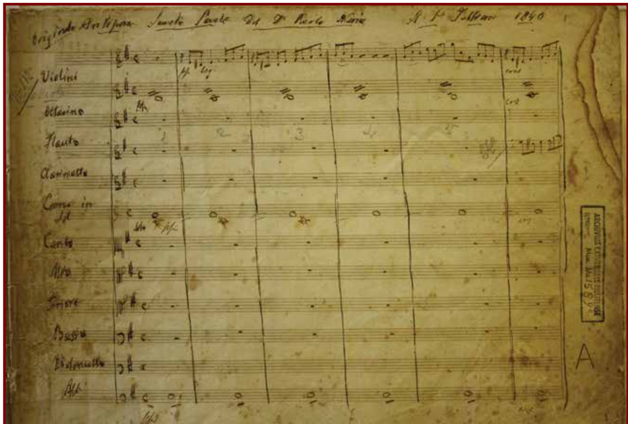
L-Antifona Sancte Paule

bil-għan biex isservi bħala introduzzjoni għall-opra. Madankollu, illum il-gurnata tirrappreżenta xogħol orkestrali. Dan il-manuskritt mhux biss juri l-influwenza qawwija Taljana fuq il-kompożituri Maltin li studjaw f'Napli, iżda wkoll jitfa' dawl dwar x'kien qed jindaqq fit-teatri Maltin tal-epoka Romantika.