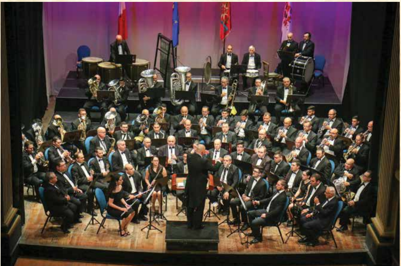
Il-Banda waqt programm muzikali fit-Teatru Manoel