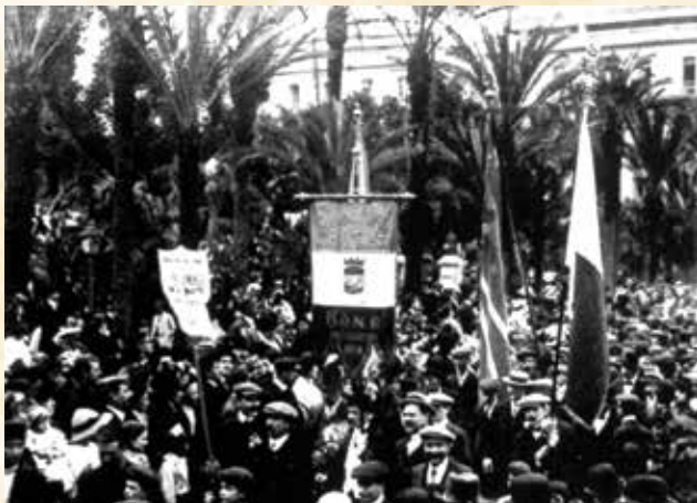
Il-Banda f'Algiers fl-1912

Il-Corriere Mercantile Maltese tal-15 ta' Frar jagħti deskrizzjoni dettaljata tas-suċċess tal-Festa u jagħlaq hekk: "Fl-aħħar nett ngħidu kelmtejn ta' tifhir speċjali lid-dilettanti bravi tal-Banda La Valette li daqqew darbtejn filgħaxija fost l-entuzjażmu tal-poplu. Il-promoturi tal-Festa għandhom għax ikunu kburin bir-riżultat eċċellenti li żgur kien superjuri għall-festi ta' qabel."