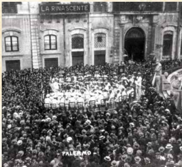
Il-Banda f'Tuneż fl-1926

La Valette malajr saret magħrufa mhux biss f'Malta, imma spiss kienet mistiedna f'diversi festi u konkorsi fi bliet barranin; fosthom f'Tuneż 1893; Catania 1906 f'konkurs internazzjonali; Bona u Algiers; iżda l-Konkurs Mużikali li sar f'Como fis-27 ta' Awwissu 1927 għadu jkun imfakkar sal-lum għaliex kien konkurs għat-titlu EČCELLENZA bejn iż-żewġ baned tal-Belt li ntrebaħ f'kull kategorija mil-La Valette.