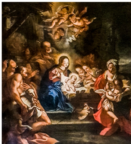
L-Adorazzjoni tar-Rgħajja, Enrico Regnaud 1728, Knisja ta' Santa Tereza, Bormla

Il-kappella tal-Lunzjata u San Anard, tal-Minsija, San Ġwann.