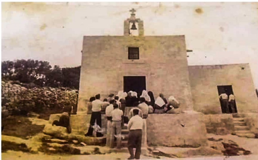
Ritratt antik tal-Kappella

Din il-kappella tat l-isem lill-lokalità li llum tissejjaħ "San Ġwann". Qabel l-1968 dawn l-inħawi kellhom ismijiet diversi: il-Minsija fuq Wied għomor, fejn hemm is-Santwarju tal-Madonna; l-Imsieraħ, bejn Triq in-Naxxar li nfetħet fil-bidu tas-seklu għoxrin u l-Kappara; Misraħ Lewża fejn illum hemm il-knisja parrokkjali, u naturalment San Ġwann tal-Għargħar, l-inħawi ta-kappella. Qatt ma kienet issir referenza għal San Ġwann biss imma San Ġwann tal-Għargħar.