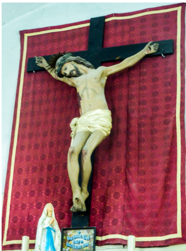
Is-Salib fuq l-altar

Il-kappella għandha sura sempliċi ħafna b'altar wiehed li l-kwadru titolari tiegħu llum jinsab fil-kunvent tal-patrijiet Kapuċċini, li hemm mal-knisja parrokkjali ta' San Ġwann. Għalkemm mhux kbir u ta' forma vertikali, dan il-kwadru, li l-awtur tiegħu mhux magħruf, juri l-qtugħ ir-ras tal-Battista. Għalkemm hu xogħol li sar tard fis-seklu sbatax, għandu laqtiet li jfakkru lil dak li jkun fl-opra magħrufa ta' Caravaggio fl-oratorju tal-knisja Konventwali ta' San Ġwann tal-Belt.