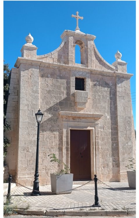
Il-faċċata tal-Kappella ta' San Filippu u San Ġakbu

Minbarra li bniha kien ra li jkollha wkoll kulma kien meħtieġ. Ħalla wkoll fundazzjoni biex jinxtegħel il-lampier fis-Sibtijiet kollha, quddiesa nhar il-festa tal-qaddisin titulari (illum fil-kalendarju nhar it-3 ta' Mejju), u quddiesa kull nhar ta' Ħadd fis-sitt xhur tas-sajf.