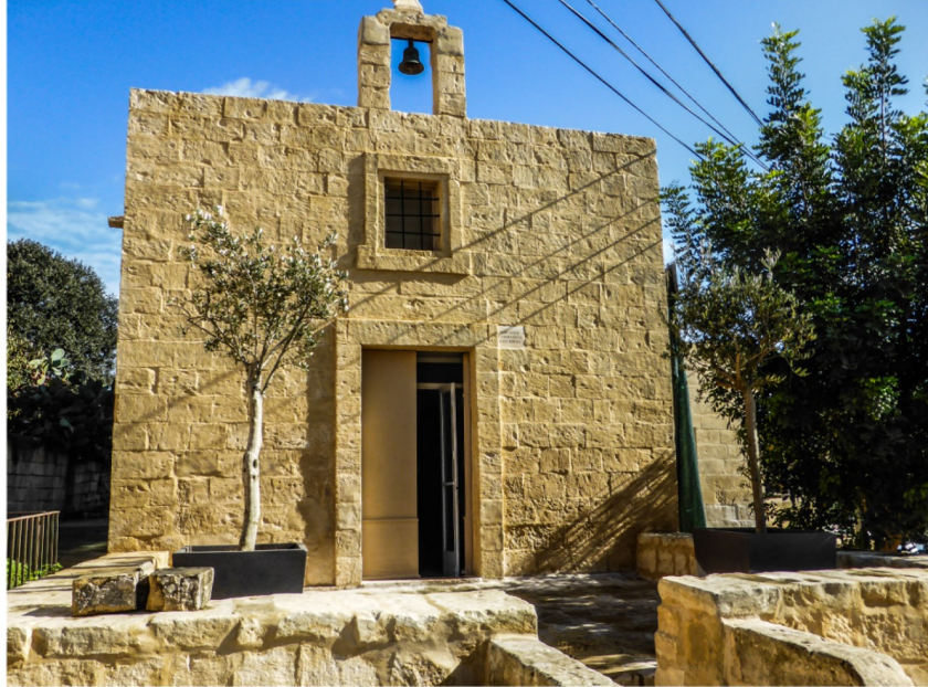
Il-faccata tal-knisja ta' San Ġwann tal-Għargħar

L-isem tal-kappella ta' San Ġwann tal-Għargħar ġej mill-inħawi li hija mibnija fih li fl-antik kienu jirreferu għalihom bħala "Tal-Harhar". Din il-kappella ma tissemmiex mal-knejjes rurali tal- cappella ta' Birkirkara fir-rapport taż-żjara tal-Viżitatur Apostoliku il-Monsinjur Dusina fl-1575. Jingħad li l-kappella nbriet fl-1546 minn familja privata li ma nafux min hi.