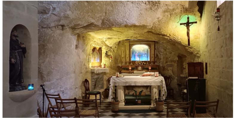
L-altar ewlieni tal-kappella tal-Lunzjata u San Anard. tal-Minsija

Fiż-żjajjar Pastoral tal-aħħar tas-seklu 16 u l-bidu tas-17, insibu li din il-knisja tissemma bħala San Leonardu tal-Ġebel, probabbilment għall-qagħda tagħha taħt sies, u l-lokalita' tissejjah " Il-Hofra tal-Għar ". Fl-1615 din il-knisja kienet għadha magħrufa bħala ta' San Anard u jingħad li kienet tinsab fix-xaqliba Ta' Saqqet il-Għar .