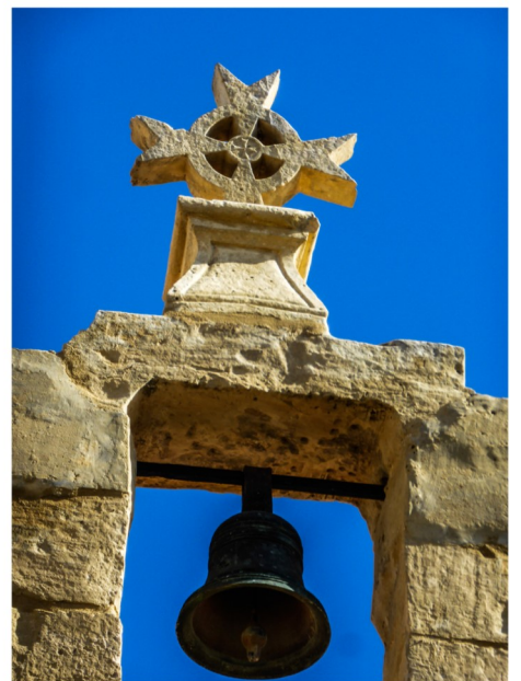
Kampnar u qanpiena b'salib bi tmien ponot tal-Ordni ta' San Ġwann