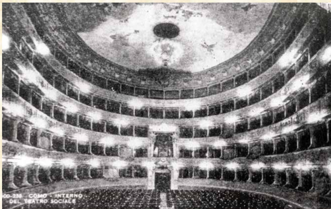
Dehra tat-Teatro Sociale fejn sar il-Konkors Bandistiku Internazzjonali ta' Como

Il-konkors fetaħ is-Sibt 27 ta' Awwissu filgħodu fit-Teatro Sociale bil-lettura a prima vista li ħadu sehem biss il-Baned "Prima Categoria" u l-Baned tal-"Categoria Superiore-Eccellenza". Fil-kategorija "Superiore-Eccellenza" kien hemm il-