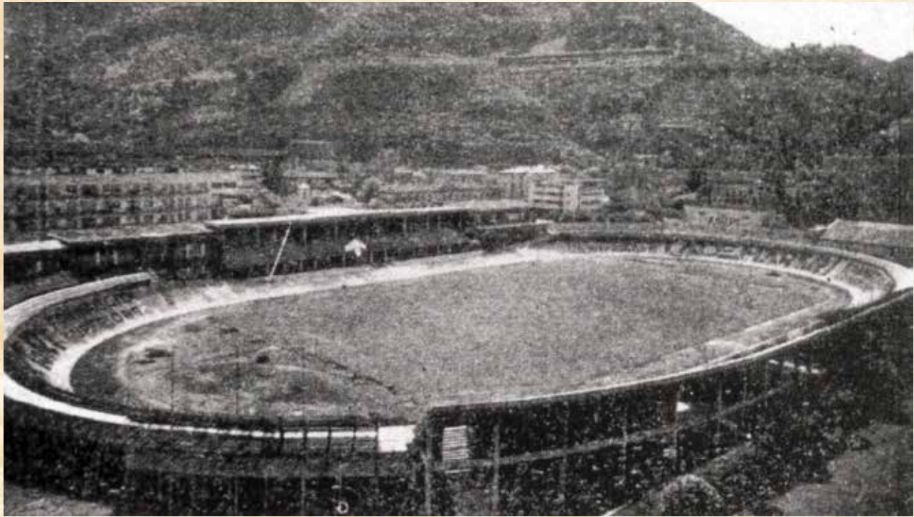
Dehra tal-Istadium fejn sar il-Kunċert Finali u fejn thabbar il-verdett finali