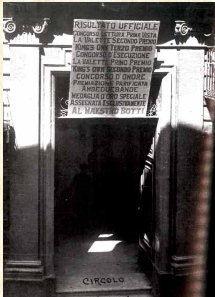
Il-faccata tal-Kazin turi r-rizultat tal-Konkors ta' Como