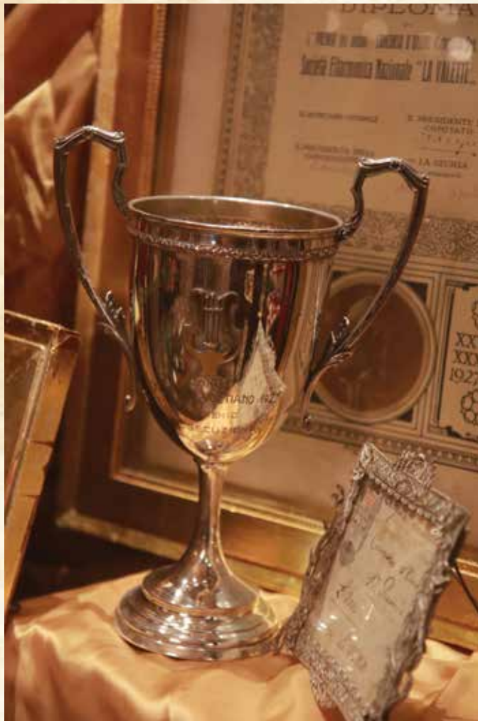
Il-Premju għall-eżekuzzjoni fil-Konkors ta' Como