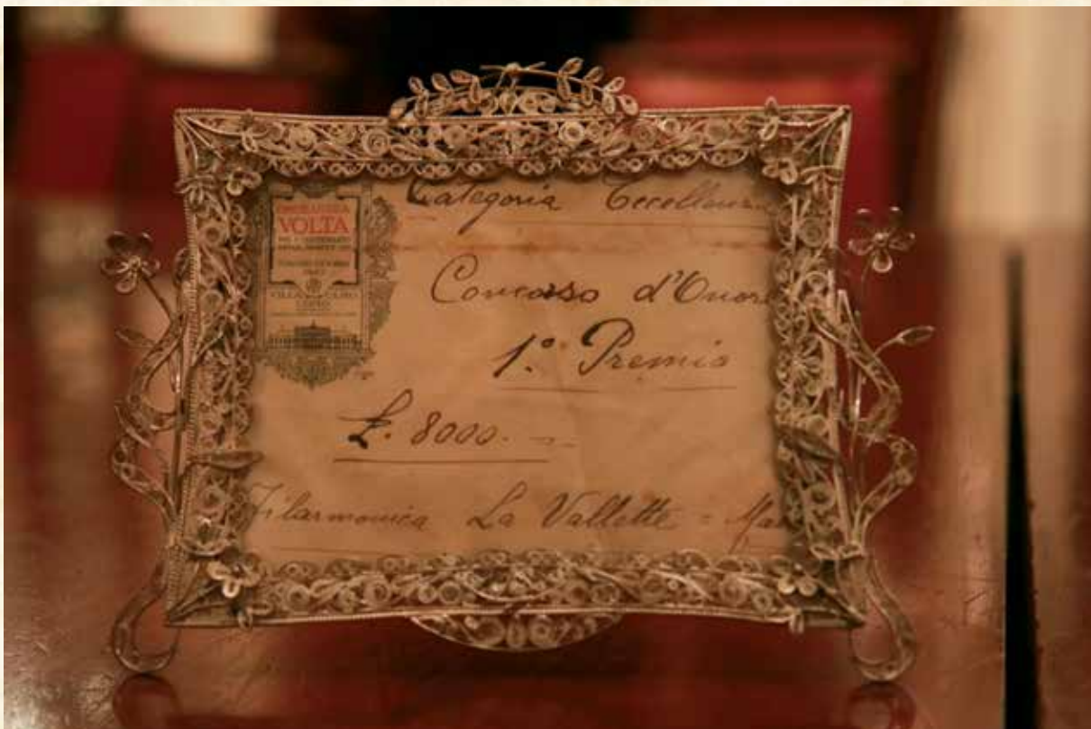
Iċ-ċekk ta' L.8000 li ħadet is-Società li kien il-Premju tal-Konkors tal-Unur Omaggio a Giuseppe Verdi