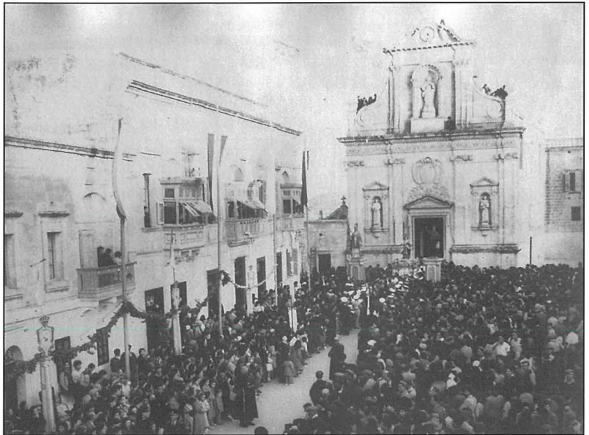
Ritratti li juri l-purċissjoni tal-Immakulata Kuncizzjoni għewwa Għawdex