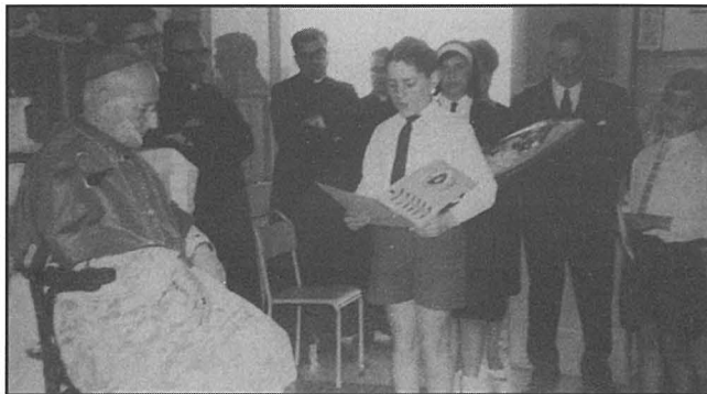
L-isqof jisma' b'attenzjoni messaġġ minn student waqt iż-żjara fl-iskola Primarja tal-Imqabba.