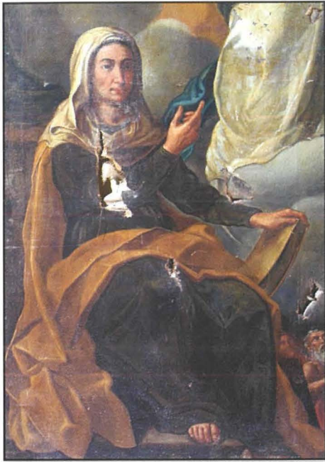
Sant' Anna żżomm ktieb f'ida x-xellugija.

Dan jixhdu l-ktieb voluminuż li Sant'Anna żżomm f'idha x-xellugija. Is-separazzjoni bejn l-ispazju temporali li fih qiegħda Sant'Anna u dak spiritwali fejn tidher il-Madonna huwa ċar. Fl-ispirtu l-kwadru hu tabilhaqq qrib dak ta' Mattia Preti (1613-99) li juri dehra tal-Madonna li tinterċedi f'mument diffiċli, bħal dak li ħolqot il-pesta, għas-salvazzjoni tal-erwieħ u l-faraġ ta' dawk li ħallew warajhom. L-għażla tax-xbihat kien wieħed li jinftiehem mill-ewwel għaliex il-ħtieġa kienet il-kult u l-qima b'għan t'interċessjoni meta meħtieġa.