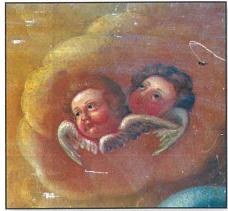
L-Uċuħ tal-puttini miżjuda aktar tard.

Stefano Erardi hu wieħed mill-aktar awturi importanti tas-seklu sbatax. 9 Jidher li kellu personalità artistika b'saħħitha għaliex xogħlu ma jimitax dak ta' Mattia Preti li kien l-artist dominanti ta' żmien. Jidher li kien jagħmel ħafna użu minn stampi u disinji li kellu f'idejh u għaldaqstant xogħlu xi minn daqqiet jidher xi ftit derivattiv. Jidher li minkejja kollox irnexxielu jpitte bosta xogħlijiet għall-knejjes u għal kollezzjonisti privati. Il-kwadru tal-artal tal-Kunċizzjoni hu tabilhaqq wieħed mix-xogħlijiet tardivi tal-artist fi żmien meta ma jibqax jaħdem daqstant kummissjonijiet tax-xorta tiegħu. Tabilhaqq, Erardi pittur l-akbar kwadru tiegħu, il-kwadru titolari tal-Knisja ta' San Pawl, (Rabat, Malta), fi żminijiet ta' wara l-pesta tal-1676. Il-kwadru, iffirmit u ddatat 1678, huwa fost l-aktar xogħlijiet ambizzjużi ta' Erardi. Erardi jnaqqas bil-bosta minn dawn it-tip ta' kummissjonijiet wara din l-opra importanti. Xogħlu jsir aktar minn qatt qabel derivattiv u jidher li jiffoka ħafna aktar fuq xogħlijiet żgħar. 10 Il-kwadru tal-Imqabba għaldaqstant jista' jkun wieħed mill-ftit kwadri tal-artali li setgħu ħarġu minn taht idejn Erardi fil-maturità tiegħu.