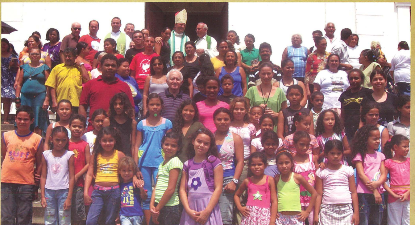
Il-parroċċa ta' Dun Ġamri Cauchi f' San Miguele de Taipù