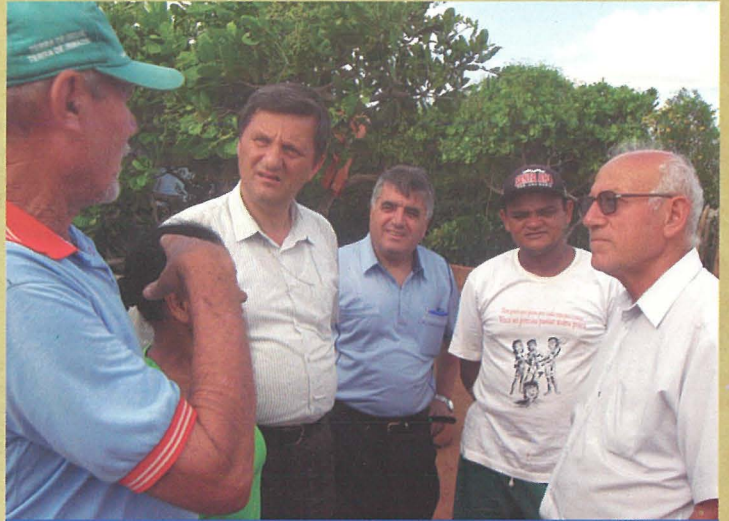
Dun Ġamri Cauchi ma' xi bdiewa f' San Miguele de Taipù

fosthom l-imħabba kbira tal-Benefatturi Maltin u Għawdxin li sostnewh b' sagrificċji kbar il-hidma tal-missjunarji tagħha. F'kull post li żorna hemm preżenti l-qalb ġeneruża tan-nies twajba tal-gżejjer tagħna. Hemm ukoll hafna tbatija, frustrazzjoni, u xi ftit qtiegħ il-qalb li huma elementi li jakkumpanjaw kull hidma marbuta mal-evanġelizzazzjoni. Imma hemm hafna x' jagħmillek kurraġġ. Hemm hafna ta' xhiex wieħed irodd ħajr lil Alla. Ma' Mons. Isqof Mario Grech għandna nħossuna kburin li xi uħud minn fost ħutna qegħdin għas-servizz ta' qadi u mħabba, f'opra ta' promozzjoni tal-bniedem shiħ. J'Alla din l-esperjenza tkompli theġġeġ lilna ukoll b' entużjażmu dejjem ġdid biex inwasslu l-Kelma t'Alla fi xtutna u lil hinn minnhom.