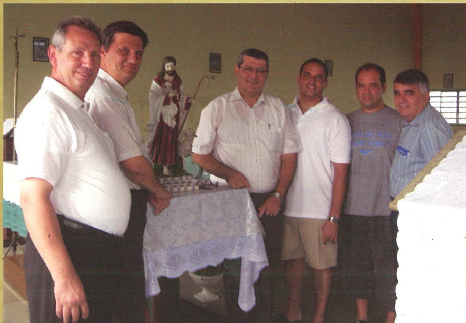
Knisja tar-Raġħaj it-Tajjeb f'Messias

Biż-żjarat tagħna f'dawn il-postijiet ta' Rio, għalaqna l-miġja tagħna fil-Brażil flimkien ma' Mons. Isqof il-Hamis l-1 ta' Ottubru 2009 fuq nota tassew pożittiva! Hemm hafna affarijiet sbieħ x'wiehed jirrakkonta,