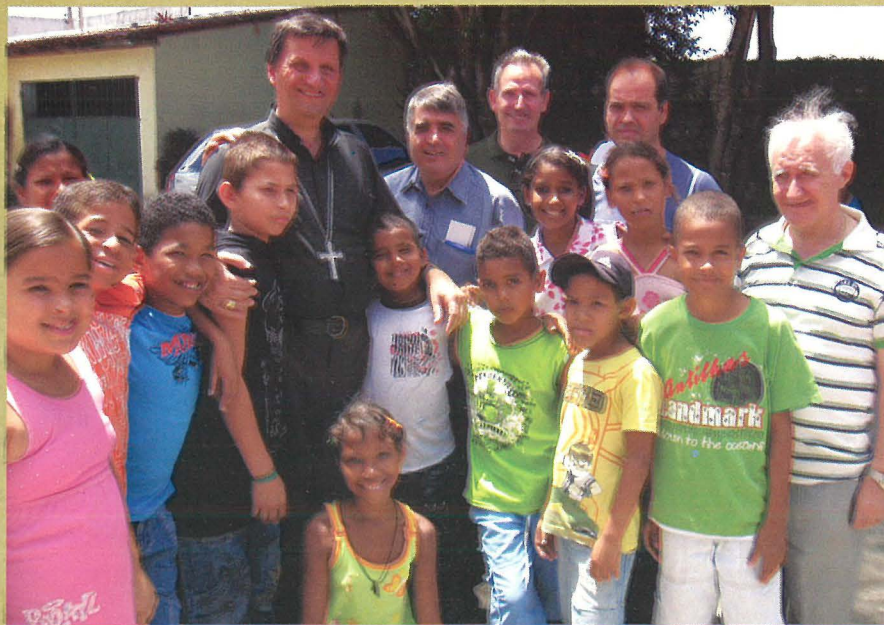
Parroċċani żgħar ta' Maceiò