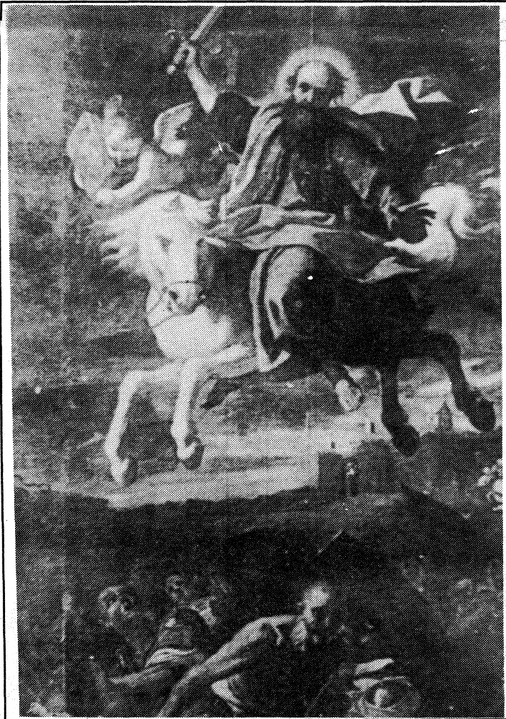
Mattia Preti: San Pawl, difensur ta' Malta, ikeċċi l-Mori (Katidral, Mdnina)

l-belt ta' l-Imdina. Peress li hadd fil-Gzejjer Maltin ma kien miet f'dak it-terremot, il-kapitlu tal-katidral ried li fil-jum ta' dak it-terremot tiġi celebrata kull sena fl-istess katidral quddiesa solenni ta' radd il-hajr — vot ta' ringrazzjament lil Alla. (11)