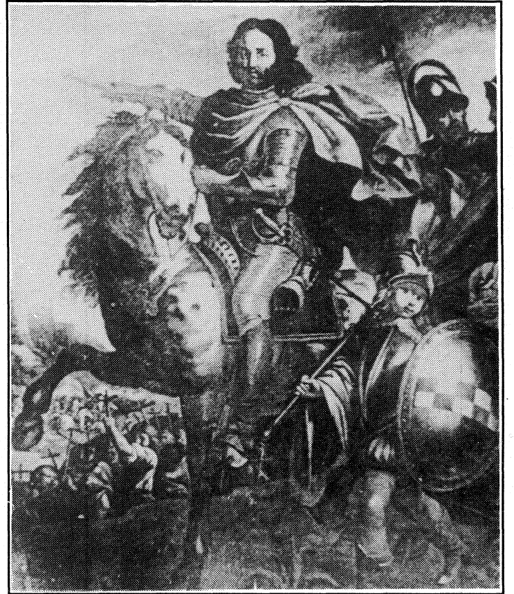
Kwadru tal-Konti Ruggieru, rebbieh fuq is-Saraceni (sagrastija tal-Katidral, Mdnina)

Fl-1419 lill-knisja sarulha xi alterazzjonijiet strutturali billi żdidilha d-driegħ trasversali