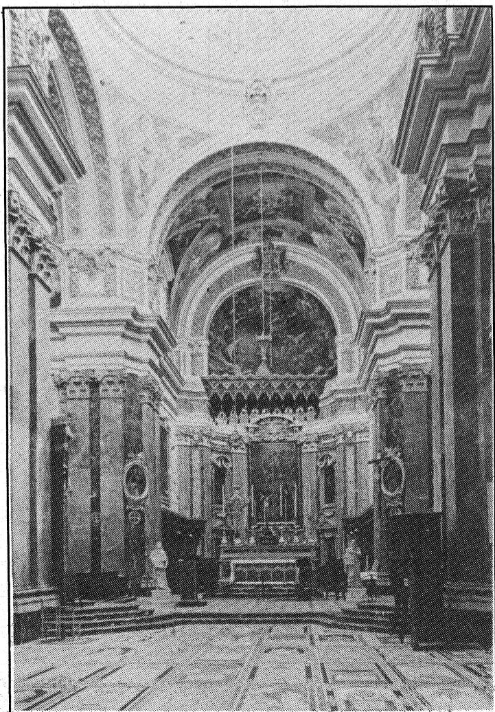
Il-Katidral ta' l-Imdina minn ġewwa