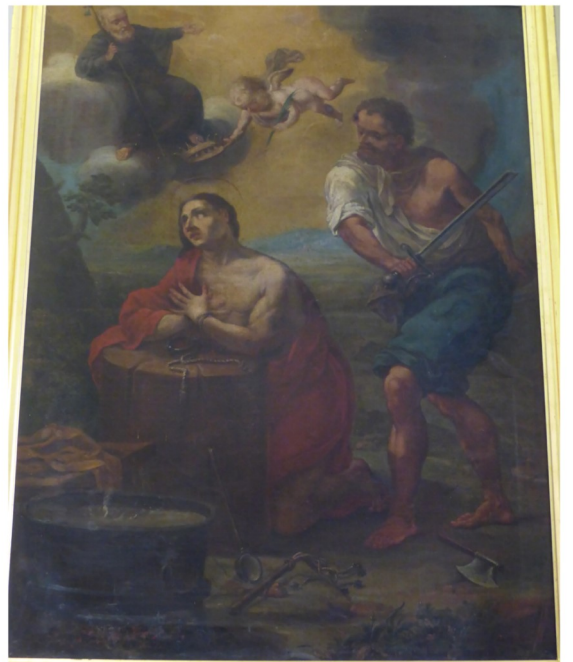
San Marzjal martri