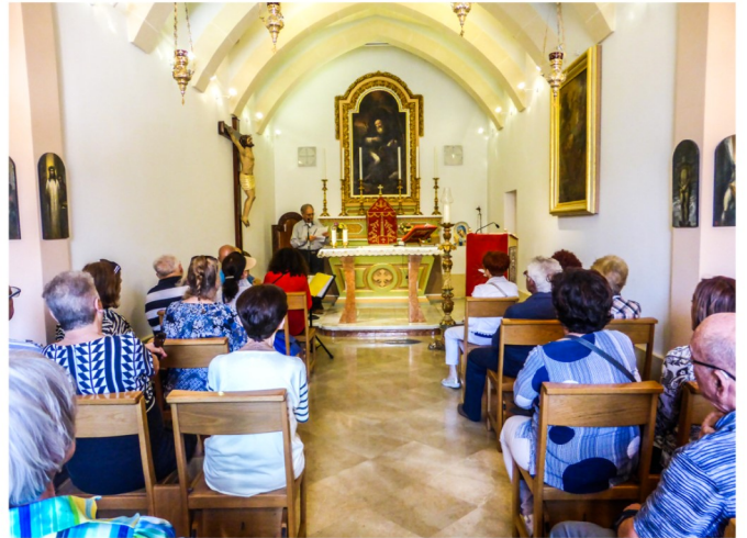
Ħarsa minn ġewwa tal-knisja ta' San Anton Abbati

Fl-1942 fit-tieni gwerra dinjija din sfat milquta minn bomba fi ħbit tal-għadu mill-ajru. Kellha tiġi iprofanata mill-Isqof t'Għawdex il-monsinjur Mikiel Gonzi, minħabba li kienet f'periklu li tiġġarraf.