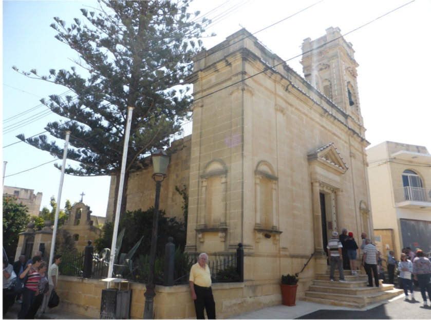
Il-faccata tal-knisja ta' San Anton Abbati

F'żona magħrufa bħala l-Qaċċa, li hija l-iktar parti għolja tax-Xagħra' insibu l-kappella antika ddedikata lil San Anton Abbati. Casal Caccia kien l-isem lix-Xagħra kien magħruf bih fl- imġhoddi.