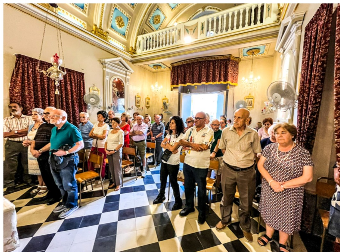
Quddiesa fil-kappella ta' Santa Luċija, Naxxar

Il-knisja ta' San Anton Abbati fix-Xgħara Għawdex