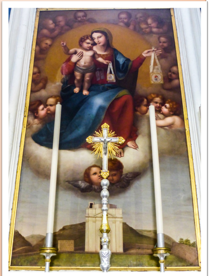
It-titular tal-Madonna tal-Karmelu

Matul is-snin tmenin din il-knisja giet irrestawrata b'mod estensiv għax kienet verament fil-bżonn. L-art li hi mibnija fuqha kienet taflija ħafna u biż-żmien kienet bdiet iċċedi. Lejn l-1982 kienet fil-periklu li taqa', u fil-fatt kienet se titwaqqa' u tinbena mill-ġdid sakemm instab mod kif tissaħħaħ l-art minn taħt. B'hekk giet salvata. Minn ġewwa meta wieħed iħares lejn l-arkati ta' bejn il-pennakki tan-naħa tal-lemin jara l-ġebel kien diġà beda jiċċaqlaq minn postu. Fis-sena 1988 beda l-bini ta' sala kbira maġenb il-knisja, fuq in-naħa