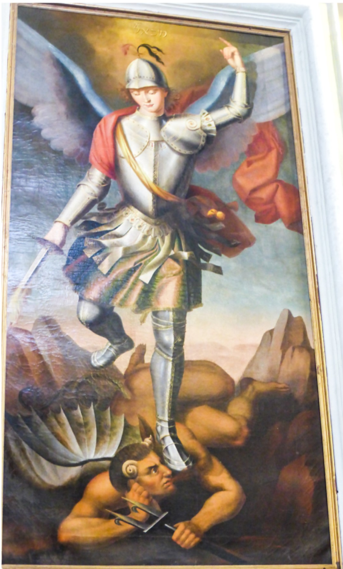
Pittura ta' San Mikiel