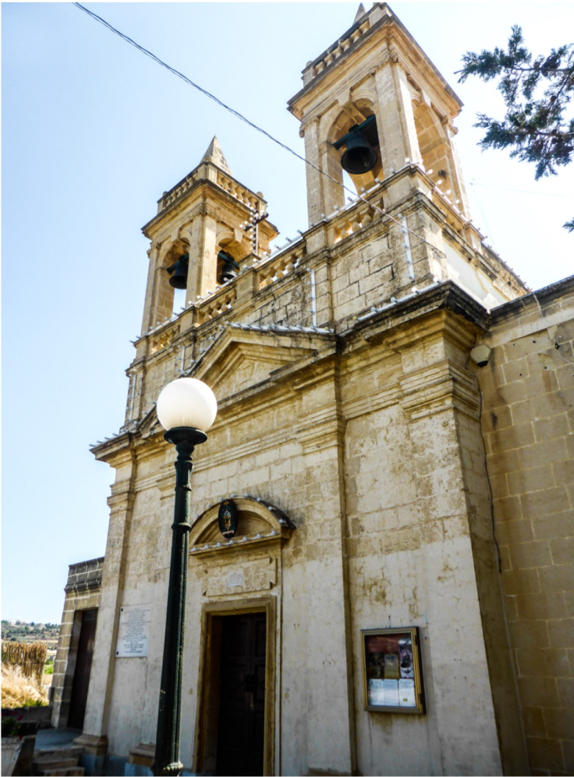
Il-Knisja tal-Madonna tal-Karmnu f'Ta Ħamet I/o Xewkija

Fix-xaqliba ta' bejn ix-Xewkija, il-belt Victoria u x-Xagħra insibu medda ta' art imsejja "Ta' Ħamet" , firxa ta' art tassew sabiħa, kollha għelieqi maħdumin, eżempju mill-aqwa ta' pajsagġ tradizzjonali Għawdexi.