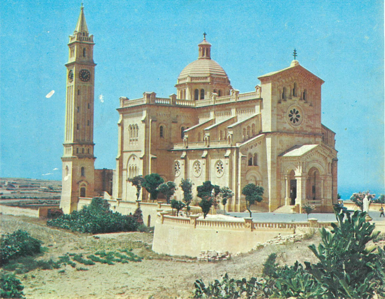
IS-SANTWARJU TA' PINU MIBNI WARA LI L-MADONNA KELLMET LIL KARMNI GRIMA.

“Il-Vergni Marija li mit-thabbira tal-Anglu laqgħet f’qalbha u f’għisimha l-Verb t’Alla u gabet il-ħajja lid-dinja, hi magħrufa u unurata bhala vera omm ta’ Alla u tar-Redentur. Hi stess meħlusa b’mod sublimi, in vista tal-merti ta’ Binha u Miegħu marbuta minn rabta iebsa li ma tinhallx, hi mgħonija b’uffiċċju l-aktar għoli u bid-dinjità ta’ Omm tal-Iben t’Alla, u għalhekk bint maħbuba tal-Missier u tempju tal-Ispirtu s-Santu: u li minħabba dan id-don tal-grazzja l-aktar għolja tisboq b’mod kbir lill-kreaturi l-oħra kollha fis-sema u fl-art. Hi madanakollu marbuta flimkien mar-razza ta’ Adam mal-bnedmin kollha fi hteġa tal-fidwa, anzi hi “tassew omm tal-membri (ta’ Kristu)...għaliex ikkooperat bl-imħabba għat-twelid tal-fidili tal-Knisja, li ta’ dak ir-Ras huma membri”. Għal dan hi magħrufa wkoll bhala l-membri singolari u ewlenija tal-Knisja u figura tagħha u mudell l-aktar perfett ta’ fidi u ta’ karità, u l-Knisja Kattolika, mgħallma mill-Ispirtu s-Santu bl-imħabba ta’ pietà ta’ bint tivveneraha bhala Omm l-aktar maħbuba”.