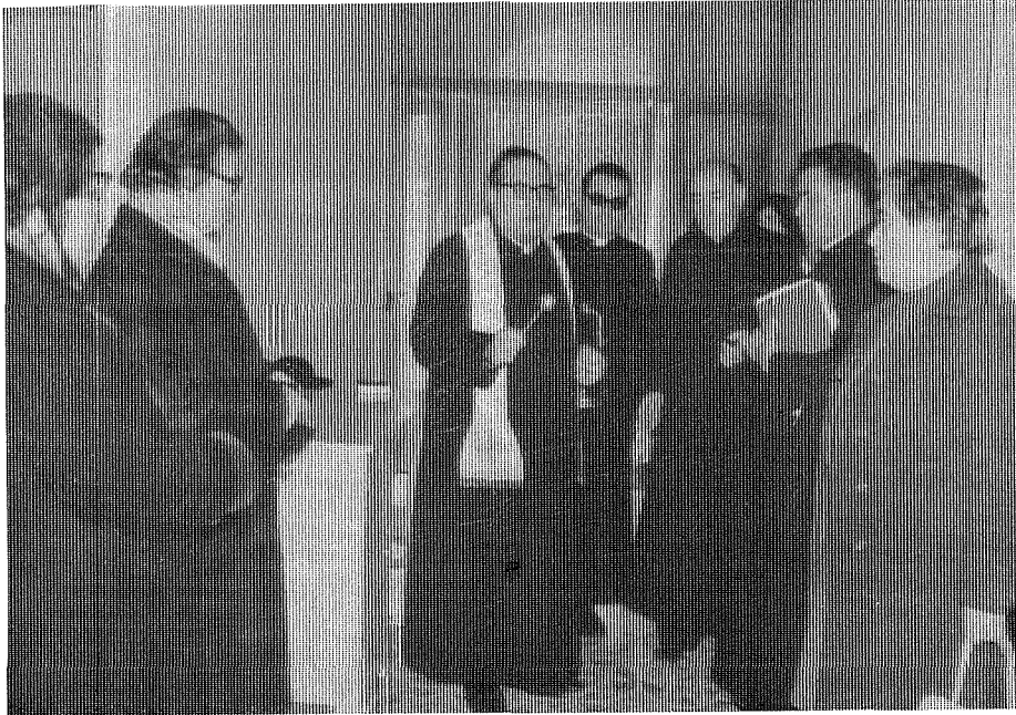
F'tuħ uffiċċjali u tberik ta' Centru Kulturali Marjan ta' Pinu mill-E.T. Mons. Isqof Nikol Ġ. Cauchi

Nota karatteristika tad-Duttrina Kattolika ta' l-aħħar seklju kienet l-interess kbir fl-evuluzzjoni tat-tagħlim dwar il-Madonna. Bid-definizzjoni tad-Dommi tal-Immakulat Konċepiment u tal-Assunzjoni ta' Marija, flimkien mal-hafna dokumenti Papali li jirrigwardaw il-Madonna, fid-dinja kiber mhux biss it-tagħlim dwarha, imma l-insara komplew jintlew bil-fidi u l-imħabba lejn din l-Omm tagħna tas-Sema.