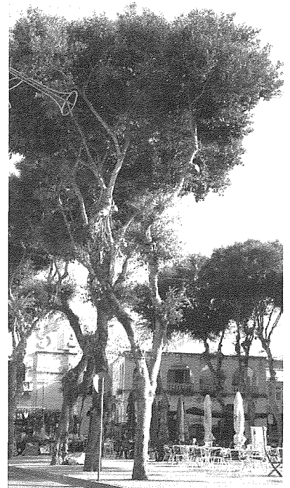
Is-Sig'ar tal-Fikus fit-Tokk

Sig'ra oħra li tikber u tgħola hafna hija s-sig'ra tal-Fikus tal-weraq folt (l-isem xjentifiku: Ficus microcarpa ). M'għandhiex isem bil-Malti minkejja li tinstab f'hafna lokalitajiet. Bl-Ingliż magħrufa b'talanqas hames ismijiet fosthom Laurel Fig u Indian Laurel . Din is-sig'ra tal-Fikus hija komuni hafna f'Ghawdex u tinstab matul