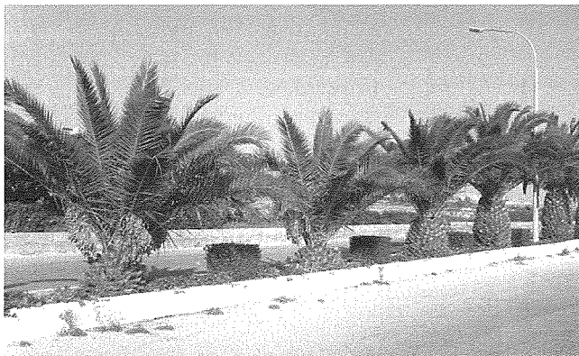
Ringiela sigar tal-Palma tal-Kanari fit-triq tax-Xaghra

Għalkemm is-sigar tal-palm ilhom li ġew introdotti f'Ghawdex, f'dawn l-ahħar snin thawlu numru mhux hażin ta' diversi speċi minnhom li ġew importati minn hafna pajjiżi. Is-sigra tal-palm li tagħmel it-tamal li jittiekkel, mhix daqstant komuni fil-gzejjer Maltin għalkemm hija