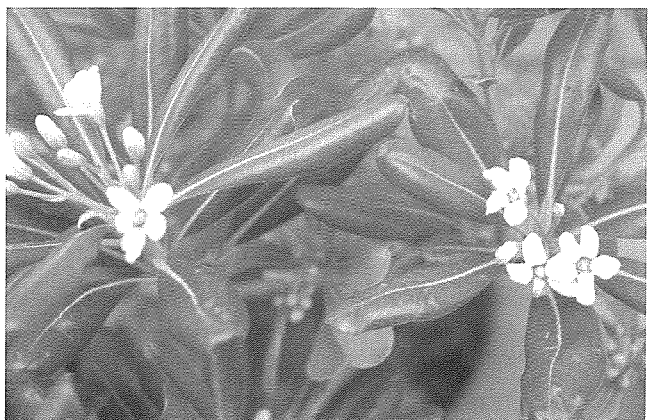
Il-fjuri u l-weraq tal-Pittisporum

Arbuxell li nsibu jikber f'xi ġnub ta' toroq f'Ghawdex huwa il- Pittisporum . Insibuh qrib il-Kappella tal-Karmnu, fit-toroq li jiehdu għall-Qala, għall-Imġarr, u għal Marsalforn; fil-pjazza prinċipali ta' Għajnsielem, u f'hafna postijiet oħra.