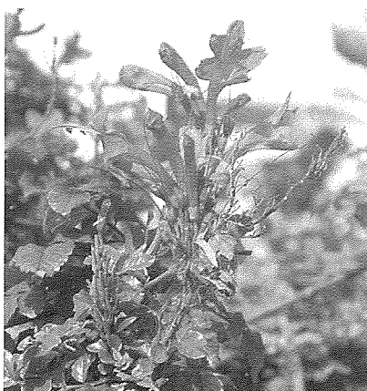
Il-fjuri tat-Tekoma Hamra

It- Tekoma Hamra hija wahda mill-varjetajiet immissla bil-kultivazzjoni ta' l-ispeċi magħrufa bl-isem xjentifiku Tecoma capensis u bl-Ingliż Cape Honesuckle . Dan l-arbuxell jikber malajr, u xi drabi jixxabbat bħal dielja u jogħla sa tlett metri. Jagħmel fjuri sbieħ homor. Varjetajiet oħrajn immisslin bil-kultivazzjoni għandhom fjuri orangjo, oħrajn roża u anke sofor. Il-kulur tagħhom ġeneralment jgħajjat u jikbru f'bukkett żgħir. Twarrad fis-sajf, matul