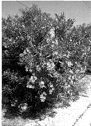
Arbuxell ta' l-Oleandru; mijiet minnhom isebbu t-toroq f'Ghawdex

F'dan ir-raba' u l-aħħar artiklu minn din is-sensiela se nagħti daqqa t'għajn lejn erba' speċi oħra ta' arbuxelli u