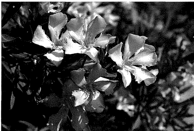
Il-fjuri ta' l-Oleandru

sig'ar li jsebbu t-toroq t'Ghawdex u l-inħawi li ngħixu fihom. Wahda minn dawn, l-Oleandru, hija komuni u mxerrda sewwa fit-toroq u l-pjazez t'Ghawdex. Kieku jkolli nsemmi fejn tinstab tikber, nimla' paġna shiħa għax kważi tinstab fl-irhula kollha speċjalment fit-toroq li jwassluk sa truf tagħhom. Il-pajjiżi originali tal-Oleandru (l-isem xjentifiku: Nerium oleander – bl-Ingliż Oleander , Rosebay jew Rose Laurel ) huma l-Ġappun u l-pajjiżi tar-reġjun tal-Mediterran u tal-Afrika. Dan l-arbuxell kbir, li wiehed jista' jiżbru biex maż-żmien jiehu forma ta' sig'ra, kif hemm fix-Xagħra u fin-Nadur, jgħola minn tlett sa ħames metri. Ihaddar is-sena kollha u jwarrad fis-sajf. Il-weraq li jitwal sa ħmistax-il ċentimetru, huwa aħdar skur u jleqq, bil-vina tan-nofs bajdanija. Il-kulur tal-fjuri jvarja ħafna skont il-varjetà kif imnisla bil-kultivazzjoni. Hemm ta' kulur vjola, roża, safrani jew abjad. Il-fjuri jistgħu jkunu sempliċi u singli jew inkella doppji u folti skont il-varjetà. Meta l-fjuri jinxfu jibqa' l-miżwet żgħir b'ħafna żerriegħa muswafa. L-Oleandru jiflaħ ħafna għall-inxufija minħabba l-kwalità ta' weraq kemxejn iebes li għandu.