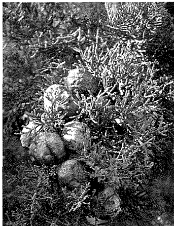
Il-frott (koni) u l-weraq tas-Siġra taċ-Ċipress

Hemm diversi speċi ta' Siġar taċ-Ċipress . Dik li tinstab fit-toroq t'Għawdex hija dik li xjentifikament jisimha Cupressus sempervirens (bl-Ingliż magħrufa l-iżjed bl-ismijiet Mediterranean Cypress jew Common Cypress ). Din għandha żewġ varjetajiet; waħda tikber dritta, twila u folta (varjetà horizontalis ) u l-oħra li tikber bil-friegħi miftuhin b'forma ta' piramida (varjetà pyramidalis ). Mhux magħruf sewwa minn fejn is-Siġra taċ-Ċipress orġinat, imma x'aktarx mir-reġjun Mediterranju Ewropew u/jew