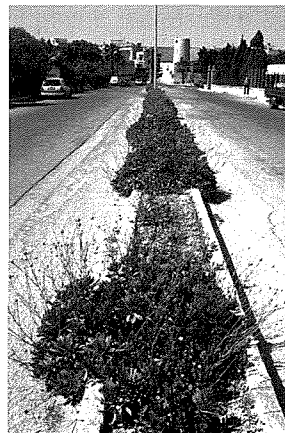
Widnet il-Baħar fit-triq quddiem iċ-ċimiterji tax-Xewkija u r-Rabat

L-ewwel isem xjentifiku li kellha kien Centaurea spathulata . Kien semmieha hekk Stefano Zerafa, mill-Għarghur, meta ddeskriviha l-ewwel darba fl-1827. Zerafa kien tabib xjenzat, awtur prolifiku, u professur tal-Medicina, tal-Patoloġija, ta' l-Istorja Naturali u tal-Fiżjoloġija fl-Università ta' Malta. Minn dakinhar sallum il-botanisti li jistudjaw is-sistematika u r-regolamenti tal-klassifikazzjoni ta' l-ispeċi, bidlula isimha talinqas tlett darbiet. Fl-1975 tpoġġiet f'ġeneru ġdid Palaeocyamus li ċ-Ċek Josef Dostal, holoq partikolarment għal din l-ispeċi, u iżjed tard, fl-1999 tpoġġiet fil-ġeneru Cheirolophus mill-Ispanjol Alfonso Susanna, wara li għamel studju molekulari dwarha. Illum magħrufa bl-isem xjentifiku Cheirolophus crassifolius . L-isem bl-Ingliż huwa Maltese Rock-centaury għax fis-selvaġġ tikber biss