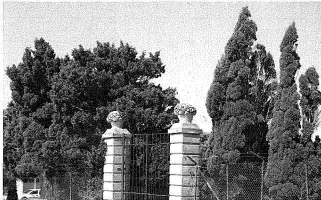
Siġar taċ-Ċipress f'Tal-Barmil, limiti tax-Xewkija. Tax-xellug varjetà piramidali u tal-lemin varjetà orizzontali

Is-Siġra Taċ-Ċipress għandha konnessjoni maċ-ċimiterji għax fl-imghoddi kienet l-iżjed siġra preferuta li tithawwel fihom, speċjalment dik il-varjetà li tgħola u ma tiehux hafna wisa'. Minbarra hekk ma kienx hawn apprezzament għas-siġar li ma jagħmlux frott li jittiekel, u s-siġar ornamental, hliet f'xi ftit toroq prinċipali, kienu jithawlu biss fil-ġonna pubbliċi u f'xi ċimiterji.