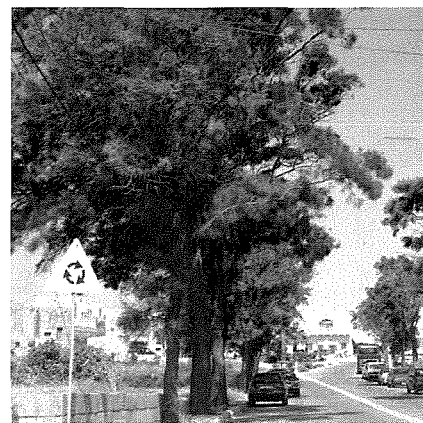
Siġar tal-Każwarina qabel tidhol ir-Rabat mit-triq tax-Xagħra u n-Nadur

equisetifolia ; bl-Ingliż: Australian Beefwood u Australian-pine , fost oħrajn). Hafna nies jaħsbuha siġra tal-Prinjol, għax il-weraq għandu l-istess forma, qisu labar twil u rqiq. Tgħola hafna anke sa 30 metru, u għandha friegħi twal u kemxejn irraq, bit-truf milwija l-isfel. Thaddar is-sena kollha imma l-kulur tal-weraq skur hafna u jagħti fil-griż. Tiflah hafna għall-inxufija u anke għall-imluħa, u tikber ukoll f'hamrija fqira. Il-weraq tagħha fih kimika li ma thallix speċi oħra jikbru u meta tistabbilixxi ruħha sewwa il-weraq li jaqa fl-art kwazi jisterelizza l-hamrija u ma jhalli xejn jikber.