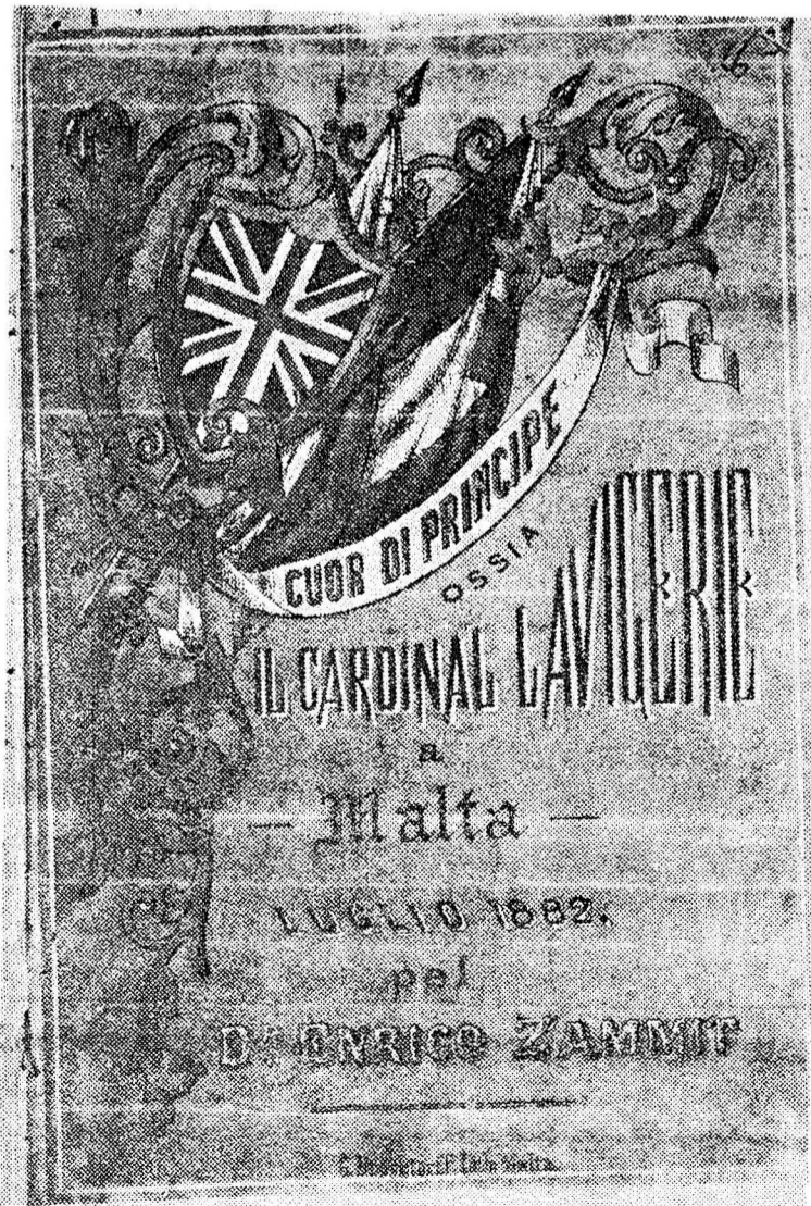
Frontispizju ta' ktejjeb li gie ppubblikat bħala tiffkura taż-żjara tal-Kardinal Lavigerie f'Malta, 1882.

— Paolo Benedetto Giuseppe Salvatore — parrini Mons. Salvatore Conte Manduca u Sinjorina Annetta dei Conti (Ikompil fil-paġna 12)