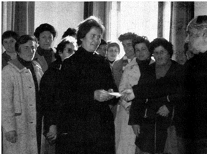
L-ewwel grupp ta' nisa li hadu hsieb jagħmlu fundraising għad-Dar