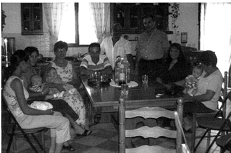
Hidma ta' fostering fid-Dar

Il-pubbliku hu ġeneruż u jħares lejn id-Dar b'lenti pożittiva, peress li d-Dar qiegħda tindirizza bżonn attwali u relevanti fiż-żmien tal-lum: dak tal-hajja fl-aspetti kollha tagħha sa mit-tnissil.