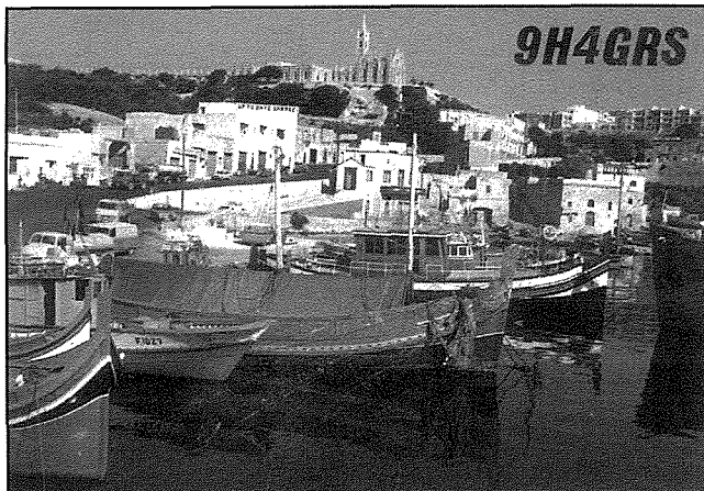
Kartolina tal-Club tagħna 9H4GRS (Gozo Radio Society) li nibgħatu wara l-kuntatti. Dettalji tal-kuntatt ikunu miktubin wara.

Jeżistu mad-dinja kollha, anke f'pajjiżna, madwar 2,000,000 dilettanti tar-radio, li mhux jisimghu biss, imma wkoll jisperimentaw, ibagħbsu fir-radjijiet u jikkomunikaw ma' dilettanti tar-radio oħra bħalhom