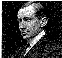
Guglielmo Marconi, l-inventur tar-radju u l-ewwel Radio Amateur fid-dinja

Guglielmo Marconi (1874 - 1937) iben missier Taljan u omm Irlandiża beda jisperimenta bl-elettriku u bl- sparks minn zghoritu, u fl-1895 baġhat l-ewwel messagġi bla wire (wireless) fuq distanza ta' mil u nofs. Fl-1896 mar jgħix l-Ingilterra u waqqaf il- Marconi Wireless Telegraphy Co. Kompla jisperimenta u fl-1901 irnexxielu jibgħat messagġ bla wire minn Cornwall l-Ingilterra għal Newfoundland il-Canada, distanza ta' 2100 mil. Fl-1909 rebaħ il-Premju Nobel għal Fizika tal-invenzjoni li holoq, il-meravilja tar-radio. Marconi barra milli huwa l-inventur tar-radio, inqisuh ukoll bhala l-ewwel Radio Amateur (dilettant tar-radio) fid-dinja.