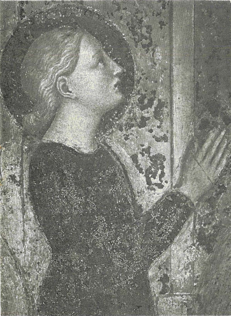
Pittura ta' S. Katarina fil-bażilika ta' S. Klement, Ruma