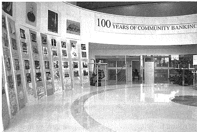
Esibizzjoni li tinsab ġewwa l-APS Centre Foyer (Swatar, B'Kara), li ser tiġtella' Għawdex fil-bidu tas-sena l-ġdida

soċjali oħra fil-lista tal-programm tal-Lega. Saddattant, il-Lega saret magħrufa bħala Unione Cattolica San Giuseppe .