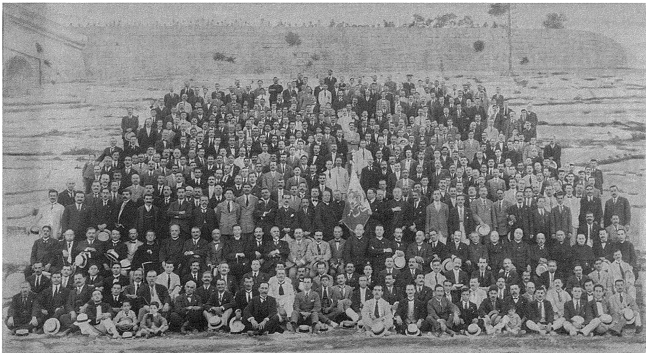
Membri tal-USCG f'ritratt meħud fl-1921