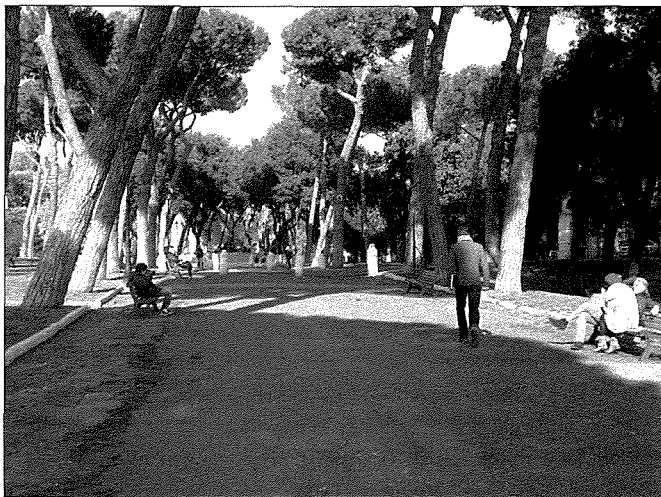
Viale Fortunato Mizzi f'Ruma

Ir-rabta ta' Fortunato Mizzi u l-familja tiegħu mal-Italja u l-kultura Taljana hija fatt tal-istorja li illum ħadd ma jista' jiċhad. Biżżejjed ngħidu li minbarra t-triq għalih imsemmija fil-qalba ta' Ruma antika mhux bogħod