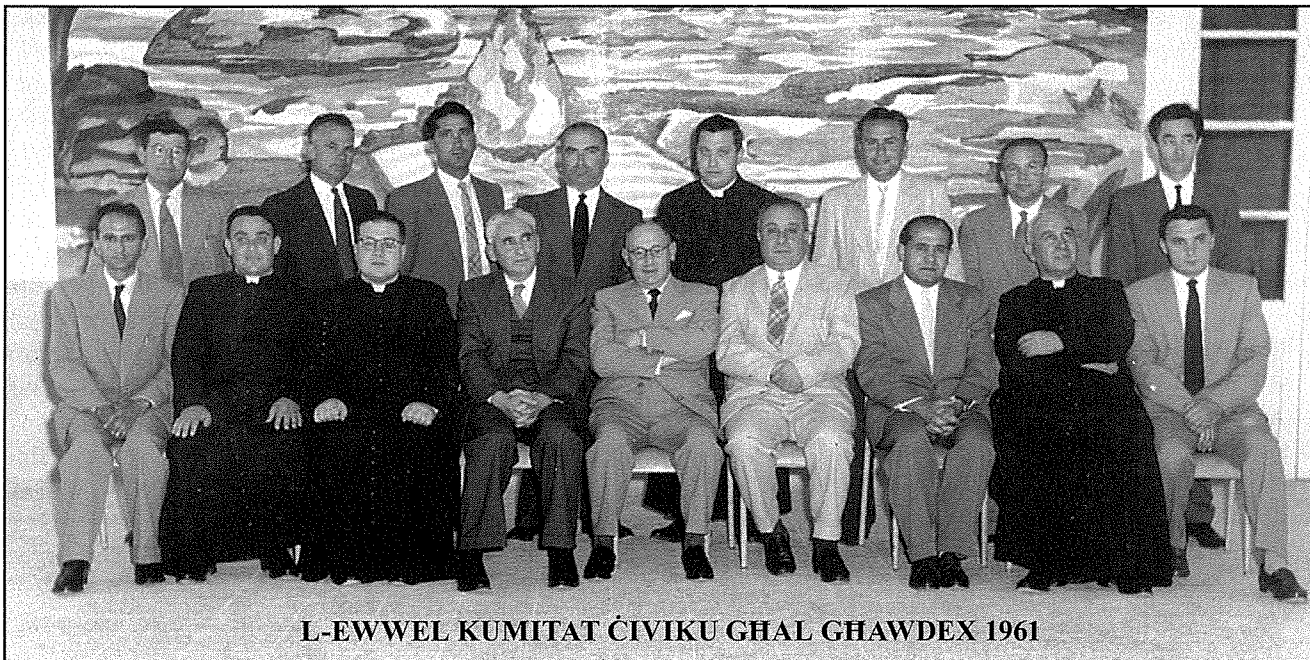
L-EWWEL KUMITAT ĊIVIKU GHAL GHAWDEX 1961

Żid ngħid li nemmen li l-attivitajiet ta' kummemorazzjoni għandhom jilħqu lill-pajjiż kollu, għax għalkemm il-Kunsill Ċiviku kien jithaddem speċifikament fil-gżira ta' Ghawdex, kien fih innifsu żvilupp istituzzjonali li serva u interessa lill-Malta ukoll. Kien u baqa' suġġett ta' rilevanza fil-pajjiż tant li l-Kunsilli Lokali kif nafuhom illum twaqqfu fis-sena 1993, għoxrin sena eżatt wara li ġie xolt il-Kunsill Ċiviku Ghawdxì.