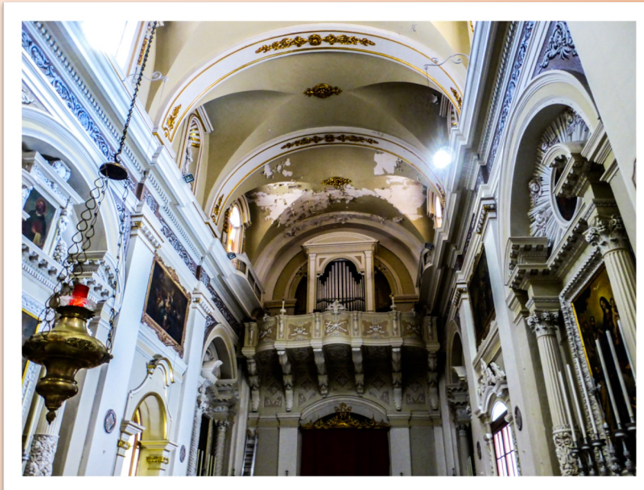
Il-gallerija fil-Knisja ta' Sidna Marija ta' Porto Salvo