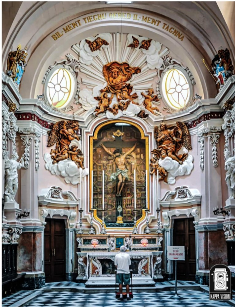
L-altar tal-Kurċifiss fl-oratorju tal-Isla

Fis-sena 1727, il-membri tal-Fratellanza tal-Kurċifiss, bdew jaħsbu biex jibnu Oratorju fuq biċċa art mogħtija lilhom mill-Kavallier Emmanuel Pinto, aktar tard Gran Mastru tal-Ordni ta' San Ġwann. Il-bini kollu tlesta fl-1733 u kienu responsabbli għalih l-arkitett Claudio Durante, il-kapumastru Francesco Zerafa u l-iskultur Pietru Pawl Zahra, it-tlieta li huma wlied din il-belt.