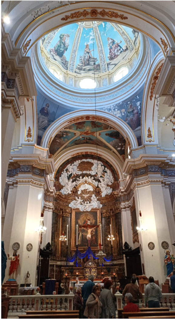
Dehra tal-knisja u l-artal maġġur

ilkoll mill-Isla, tħajru jifflu Oratorju ta' San Filippu Neri fl-Isla stess. Fit-28 ta' Marzu 1662, l-Isqof Balaguer ħareġ id-digriet li bih laqa' t-talba biex dawn il-qassisin jgħixu f'komunità taħt ir-Regola li San Filippu Neri kien kiteb għall-qassisin f'Ruma. L-Isqof għadda f'idejhom wkoll il-knisja antika tal-Madonna tal-Porto Salvo. Filwaqt li huma baqgħu taħt il-ġurisdizzjoni ta' l-Isqof, il-kappillan żamm id-dritt tal-propjetà tal-knisja u tal-art ta' madwar il-knisja, inkluż il-mezzanin li kien inbena fl-1655.