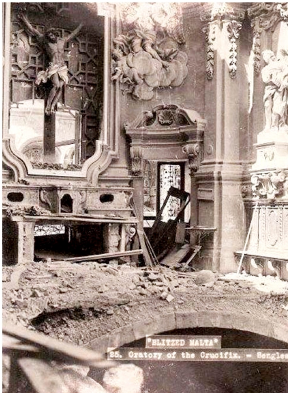
L-oratorju tal-Kurċifiss fi żmien it-Tieni Gwerra Dinjija

L-ebda informazzjoni ma nstabet dwar l-origini ta' din l-istatwa jew min ħadimha. Li hu żgur hu li tmur lura lejn il-bidu tas-seklu 18, u d-devozzjoni lejn din l-istatwa kien mill-bidu net minn meta nġiebet f'Malta. Fis-seklu 19, eżattament fl-1813, Malta inħakmet mill-pesta qerrieda, b'mijiet imutu kull ġimgħa. Il-Kapitlu tal-Parroċċa ħalef li jekk l-Isla tinħeles mill-pesta jzommu tliett purċissjonijiet fis-sena, fosthom bl-istatwa tar-Redentur, li għada ssir sal-lum.