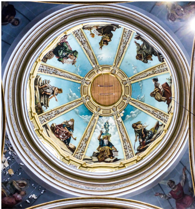
Il-koppla minn ġewwa fil-Knisja ta' Sidna Marija ta' Porto Salvo