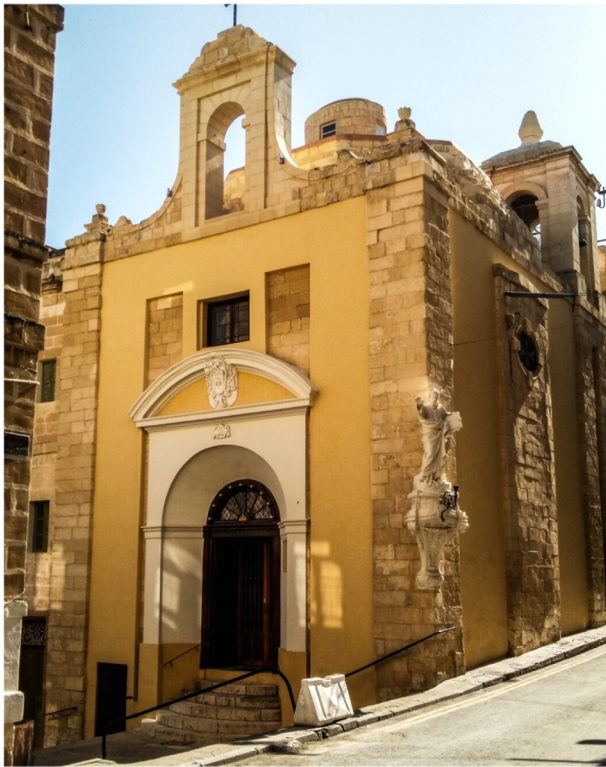
Il-faċċata tal-knisja ta' San Ġiljan

Waħda mill-knejjes li nsibu f'din il-Belt hija dik iddedikata lil San Ġiljan. Din il-knisja tmur lura għas-sena 1311, meta Malta kienet għadha taħt il-ħakma tal-Aragoniżi. Ma' din il-knisja kien hemm ukoll ċimiterju. Din inbniet f'post li kien diġà msejjaħ l-Għolja ta' San Ġiljan. Dan il-lokal hu f'it metri biss 'il fuq mill-livell tal-baħar.