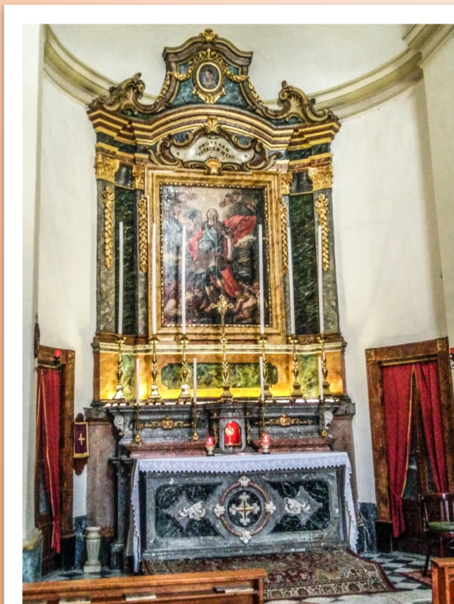
L-altar maġġur fil-knisja ta' San Ġiljan

Fl-aħħar gwerra dinjija l-bini ta' madwar il-Knisja ta' San Ġiljan waqa' kważi kollu bil-ħbit tal-għadu. Ghalkemm il-Knisja innifisha baqgħet sħiħa, sofriet ħafna ħsarat mill-blast tal-bombi li waqgħu fuq id-djar fil-viċin.