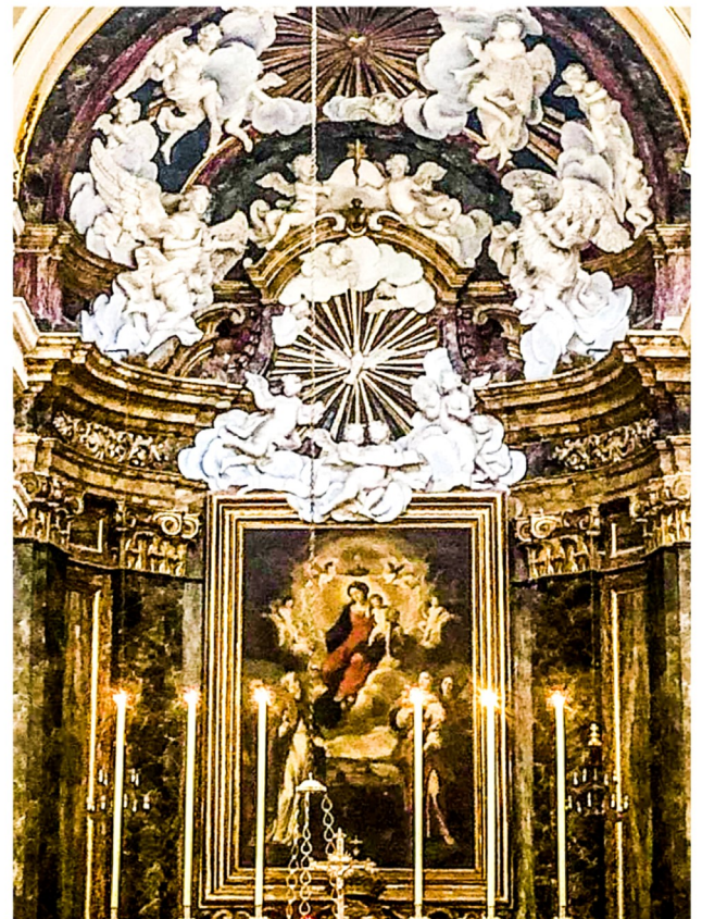
Il-kwadru tat-titular u apside

Il-knisja ġdida ġiet imzejna b'opri ta' skultura u bi kwadri artistici mill isbaħ. Il-kwadru titulari tal-Madonna tal-Porto Salvo tbierek il-Port il-Kbir, huwa xogħol ta' Stefano Erardi (1690). Flimkien mal-Madonna, jidhru erba qaddisin: Sant'