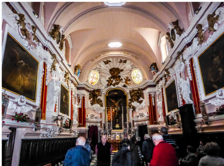
Harsa lejn l-oratorju tal-Isla