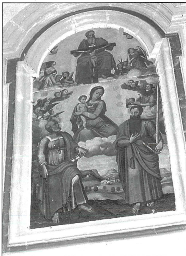
It-titular tal-kappella ta' Bir Miftuħ – xi whud jghidu li hu xoghol ta' Timideo della Vita, oħrajn isostnu li tptter lejn l-aħhar nofs is-seklu sittax.

Fin-nofs tal-kwadru hemm imbaghad il-Madonna b'Ġesù fuq hoġorha. Il-figura tal-Madonna hija murija qeghda thares l-isfel, kif ukoll Ġesù. Fl-istess hin, l-id ix-xellugija ta' Ġesù hija merfugha 'il fuq bhala sinjal ta' benedizzjoni. Minhabba li l-harsa kemm tal-Madonna kif ukoll ta' Ġesù qeghda l-isfel, u bejn iż-żewġ qaddisin hemm il-kampanja, wiehed jista' jifhem li din il-benedizzjoni ta' Ġesù hija lejn l-art li hemm impinpija. Minn kif inhu