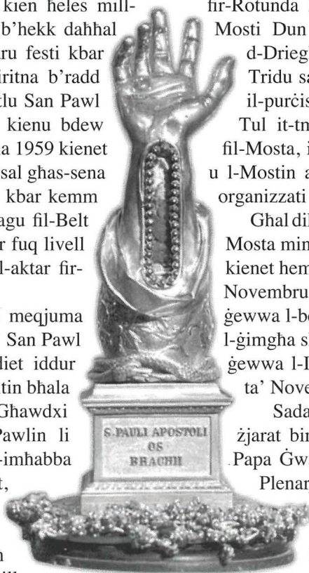
Id-Driegħ ta' San Pawl Appostlu li tinsab meqjuma fil-Kollegġjata ad unur dan il-Qaddis tal-Ġnus fil-Belt Valletta u li kienet ġiet il-Mosta fl-1959.

Sadanittant fl-okkażjoni ta' dawn id-diversi żjarat bir-Relikwa li kienu saru fil-parroċi, il-Papa Ġwanni Pawlu XXIII kien ta l-Indulġenzi Plenarji fl-okkażjoni tas-sena preparatorja spiritwali għaċ-Ċentinarju Pawlin. L-Indulġenzi Plenarji kienu jintrebhu bejn żjarat lir-Relikwija waqt li tkun esposta għall-qima f'xi parroċa, għal dawk li kienu jiehdu sehem fil-funzjonijiet fil-knisja fejn tkun ir-Relikwa u għal dawk li jiehdu sehem fil-purċissjoni bir-Relikwa.