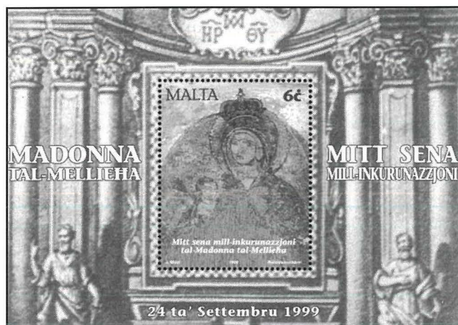
Bolla li tfakkar il-mitt sena mill-inkurunazzjoni tal-Madonna tal-Mellieħa li sehħet fl-24 ta' Settembru, 1899.