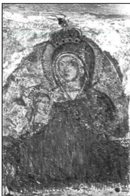
Ix-Xbiha Mirakoluża tal-Madonna tal-Mellieħa meqjuma fil-għar biswit is-Santwarju tagħha.

L-ewwel tifikiriet tiegħi jehduna fi żmien l-aħhar gwerra dinjija – speċjalment fl-1942, meta l-hbit mill-ajru kien l-ehrex. Għalhekk il-ġenituri tiegħi ddeċidew li aħjar li lilna ż-żgħar fil-familja jehduna għand waħda miz-żijiet, billi l-Mellieħa ma kinitx esposta għall-hbit mill-ajru daqs il-Mosta. Dak iż-żmien kelli hames snin, imma niftakar meta waslet l-aħbar li l-knisja tal-Mosta giet milquta mill-bomba tal-għadu, u li kienu waqgħu xi bombi ohra li kkaġunaw