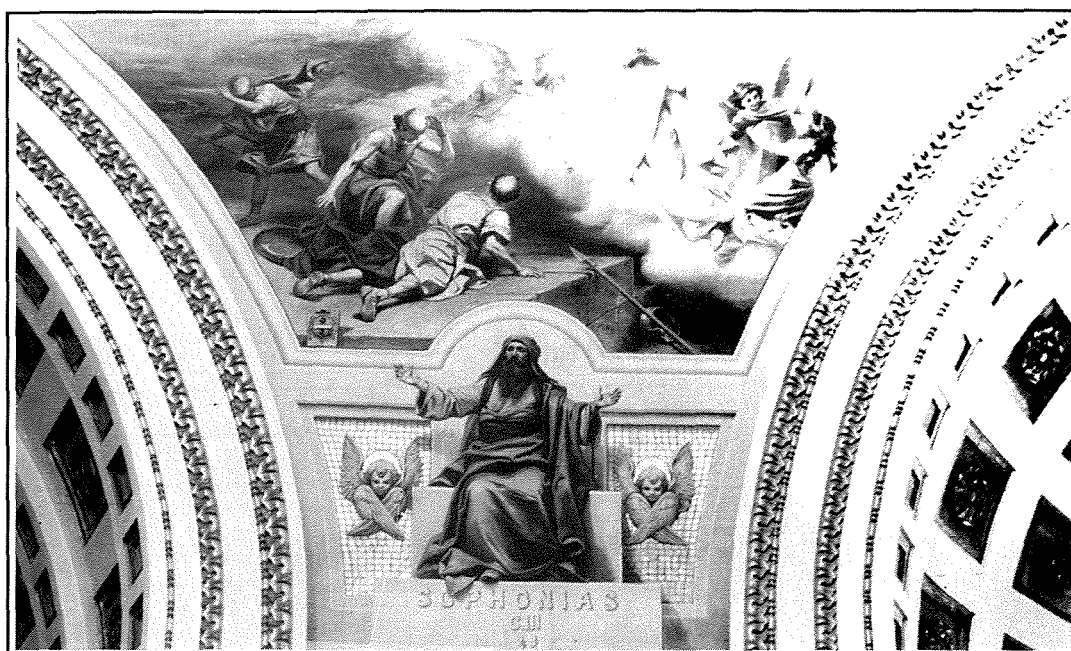
SOFONIJA - ippriedka bejn is-snin 640 - 609 QK kontra l-ħażen ta' zmienu u heġġeġ għall-indiema. Hu profeta minuri.