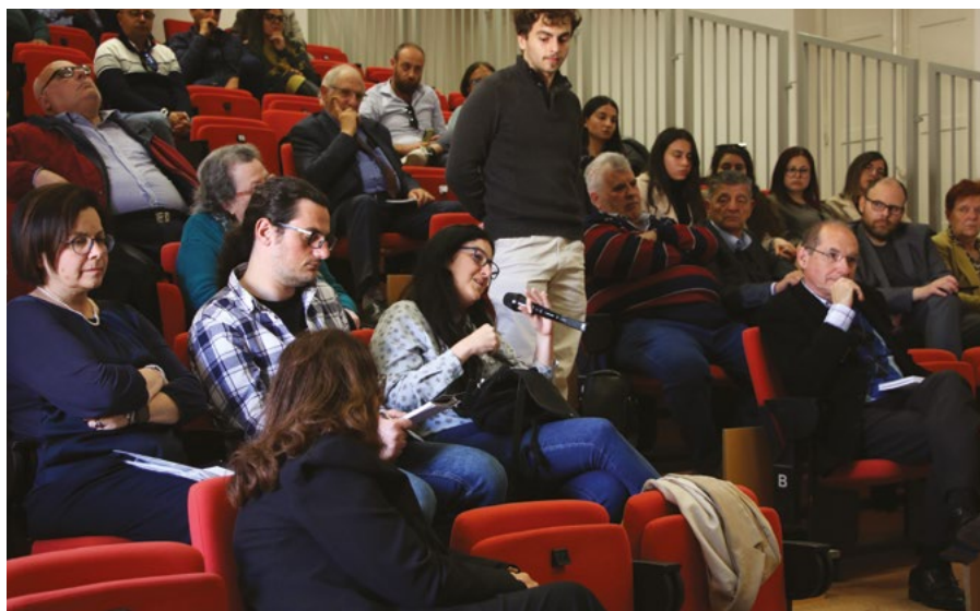
Il-partecipanti li attendew għal Lingua-Politik 2