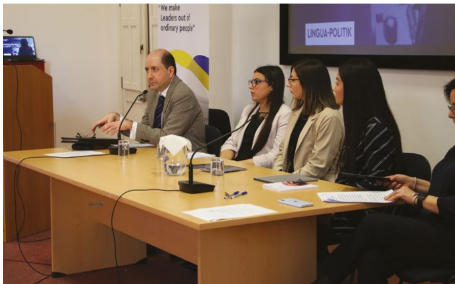
Xi wħud mill-kelliema jiddjalogaw mal-udjenza

Xogħol, ġustizzja, libertà Mhux biċ-ċajt, bis-serjetà Għaliex taf x'jorbot u jħoll? Illi Malta tagħna lkoll.