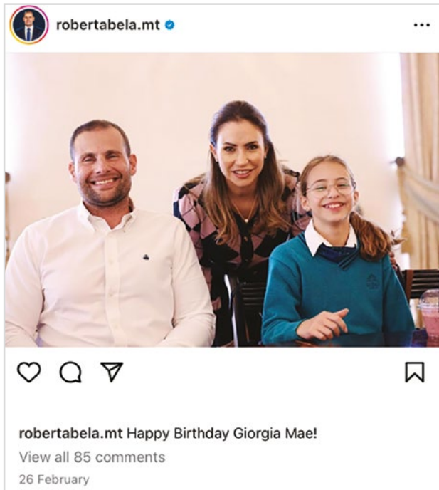
Ritratt meħud mill-profil ta' Instagram ta' Robert Abela

Bl-istess mod iżda, il-mezzi soċjali qegħdin iwasslu għal evoluzzjoni ta’ dawn il-mekkanizmi ta’ persważjoni li semmejt aktar kmieni. Pereżempju, is-solidarjetà, li permezz tagħha politiku jixtieq jidher bħala wieħed mill-poplu, illum forsi aktar probabbli li tasliha permezz ta’ ritratt fuq Instagram, fejn fiha pereżempju naraw politiċi mal-familja tagħhom jiċċelebraw xi avveniment, jew li fih jidhru mdawra b’zgħażaġh jew jilagħbu xi logħba futbol, bħalma nistgħu naraw f’dawn il-posts taż-żewġ mexxejja ewlenin tal-preżent.