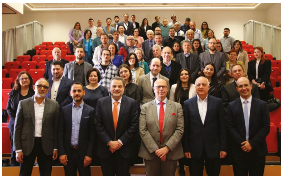
Il-partecipanti tal-Konferenza dakinhar tat-22 ta' April 2023 fl-Aula Prima, Valletta Campus