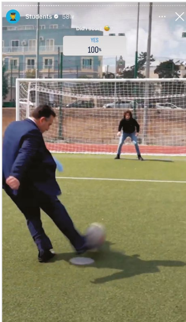
Ritratt mehud mill-profil ta' Instagram ta' Bernard Grech

Barra minn hekk, il-kelliema, meta jfasslu d-diskorsi tagħhom, probabbli jżommu f'moħħhom il-fatt li l-kontenut tagħhom se jkun qed jikkompeti ma' bosta oħra, kemm politiċi u mhux, fuq il-feeds tal-udjenza, u b'hekk, il-mekkanizmi li bihom iżommu l-attenzjoni tal-pubbliku ħafna drabi jew jinbidlu, jew jeħtieġ li jiġu amplifikati.