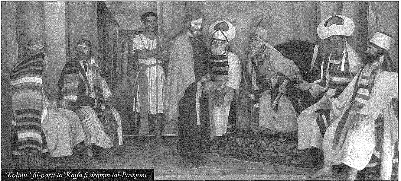
"Kolinu" fil-parti ta' Kajfa fi dram tal-Passjoni

ta' madwar. L-armi tagħhom kienu jkunu biççiet tal-injam, sintendi pprovduti lilhom mill-'general'! Darba kienu jilagħbu qrib l-għolja Ta' Għammar u ħin bla waqt beda air raid . It-tfal twerwru għaliex l-ajruplan tal-għadu għadda fil-baxx. Kien dakinhar li l-istess ajruplan kien fetaħ in-nar fuq Pjazza Savina fir-Rabat, għamel ħsarat u qatel xufier ta' xarabank. Qalulna qraba tal-Isqof, li dakinhar Koli u s-suldati tiegħu grew lejn Ta' Pinu biex jirringrazzjaw lill-Madonna li ħelsithom mill-gwaj.