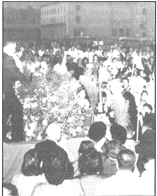
Id-Driegħ lura Malta fuq il-Fossos, tal-Furjana.

Futna l-Maltin emigranti hassewhom wisq onorati li ġibnilhom l-iktar hađa għaziża li għandna Malta u apprezzaw hafna l-interest