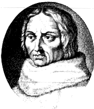
Jean Charlier de Gerson

Għadew iktar minn sitt mitt sena meta l-Kbir Kancellier Jean Gerson ried li San Ġużep ikun Patrun tal-Knisja fil-Koncilju ta' Kostanza. Dan Jean Charlier de Gerson tweled f'Barby f'Champagne fid-djoċesi ta' Rheims fi Franza fit-13 ta' Diċembru 1363 u miet nhar it-12 ta' Lulju fis-sena 1429 ġewwa Lyon fl-età ta' 65 sena. Huwa kien persuna ekkleżjali u skular għoli, u teologu magħruf, jusefologu u kittieb kbir. Huwa studja bejn l-1377 u l-1394 fl-Università ta' Pariġi taħt Pierre d'Ailly fejn kiseb id-dottorat. Huwa lahaq kancellier tal-Università ta' Pariġi fl-1395 u kanonku tal-Katidral Notre Dame ta' Pariġi. Fl-1403 lahaq Kurat ta' Saint Jean en Greve. Huwa ħadem biex tissolva l-kwistjoni tal-Papat kemm fil-Koncilju ta' Pisa fl-1409 u kemm fil-Koncilju ta' Kostanza fl-1414 fi żmien ta' żewġ anti-papiet u l-papa awtentiku. Fil-koncilju ta' Kostanza huwa kien il-kap tad-delegazzjoni Franciża. Wara l-koncilju ta' Kostanza fl-1419 huwa mar jgħallem fi Vjenna, fejn ħalla influwenzi fuq l-universitajiet ta' Strasbourg, Heidelberg u Tubinga. Huwa dejjem wera fedeltà lejn il-Papa speċjalment meta