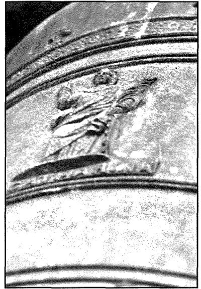
Tal-Klawdin - Żejtun