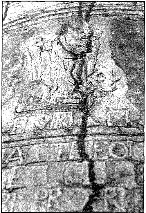
L-Antika - Żurrieq

L-eqdem żewġ qniepen fiż-Żurrieq saru fl-1653. Dawn saru minn Antonino Guirerra ġewwa Messina fi Sqallija. Iż-żghira fosthom tissejjah tač-čerimonji filwaqt li l-oħra tissejjah l-antika peress li kienet il-kbira l-antika ta' qabel li hemm illum. Din fiha x-xbieha ta' Santa Katarina b'xabla u ras Massiminu hdejha. Fuq in-naħa l-oħra hemm il-Kunċizzjoni mdawra b'sitt wardiet. Illum il-ġurnata, fuq din il-qanpiena jdoqq l-arloġġ tal-knisja u għandha nota ta' A(La). 6