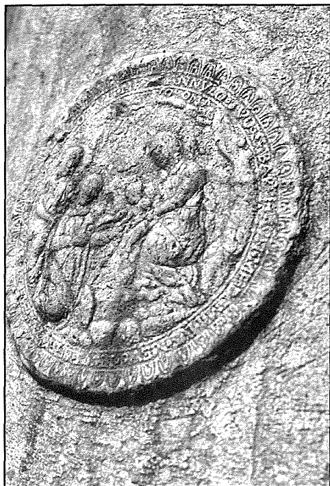
Tal-Quddies - Żurrieq