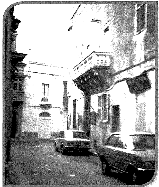
Triq Brittanja, illum Triq Ir-Repubblika fir-Rabat. Il-Kazin tal-Amore kien fil-post bil-bieb nru.1. Aktar tard dan il-post serva bħala l-klabb tal-futbol tar-Rabat Ajax FC.