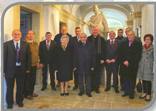
Iż-żjara tal-E.T. Dr George Vella, President ta' Malta fil-Kumpless Pawlin u l-Mużew Wignacourt.