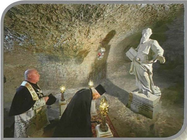
Il-Q.T. Patrijarka Bartilmew, flimkien mal-Arcipriet, waqt mument ta' talb fis-Santwarju tal-Grotta ta' San Pawl.