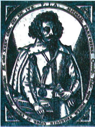
Michael Praetorius (1571-1621)

Jekk noqorbu eqreb lejn zminijietna, innu iehor sabih tal-Avvent li jezisti wkoll f'verzjoni Maltija huwa 'Venez, Divin Messie', innu Franciz li nkiteb fis-seklu 16 u li bil-Malti nsibuh jibda bil-kliem 'Ejja, Divin Messija, l-għajnejn u l-qlub jixxenqu l-jum li fih tidhrilna l-ħniena w Adam mill-mewt iqum'.