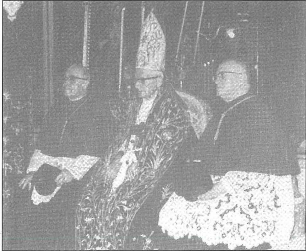
Fis-sena 1955 Mons. Arcisqof Gonzi approva li l-festa ta' Santa Katarina tibda ssir fis-sajf

L-mewt tal-Papa Ġwanni XXIII, li ġrat propju fit-3 ta' Ġunju, il-festa kellha tiġi trasferita u ċelebrata minflok fis-7 ta' Lulju. L-aħħar festa f'Ġunju kienet dik tal-1973, għaliex mis-sena ta' wara fuq xewqa tas-Socjetà Mużikali Santa Katarina, il-festa bdiet tiġi ċelebrata fl-ewwel hadd ta' Settembru. Izda l-Knisja taż-Żurrieq ma nsiet qatt il-jum tal-25 ta' Novembru u kull sena dan għadu jiġi ċelebrat bl-għosrien u b'quddiesa kanata bil-paneġierku u bi trāslazzjoni u reposizzjoni tar-relikwija tal-Qaddisin.